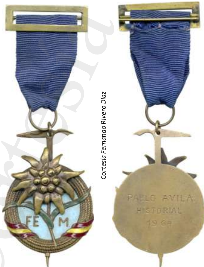
MEDALLA DE BRONCE DEL MONTAÑISMO. CINTA AZUL

7.ª La Medalla de oro se concederá por el delegado nacional de Educación Física y Deportes, a propuesta del Consejo Directivo de la FEM, que será quien conceda, a su vez, las Medallas de plata y bronce.