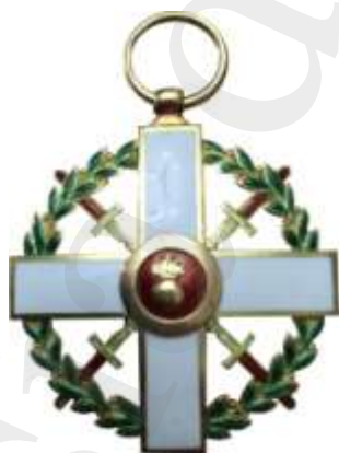
Colección Campidoctor 1