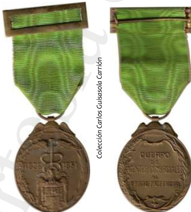
MEDALLA DE BRONCE AL MÉRITO PROFESIONAL