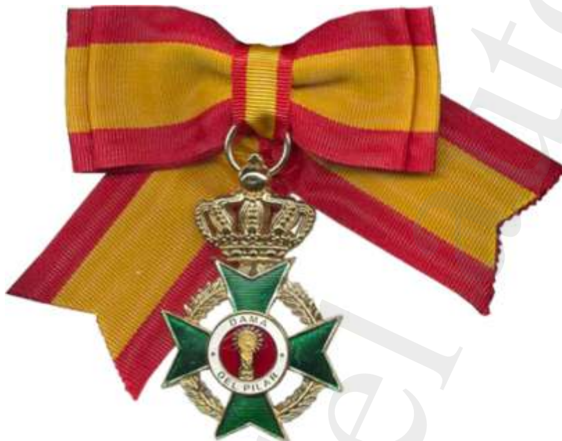
MEDALLA DE DAMA DEL PILAR

— Otros de similar analogía, no especificados, que a criterio de la Junta Directiva merezcan tal distinción.