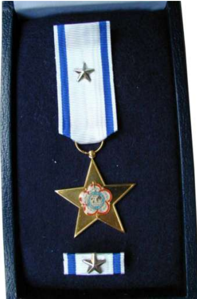
ESTRELLA DE BRONCE