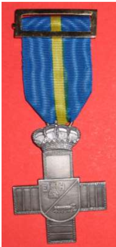
CRUZ DE PLATA