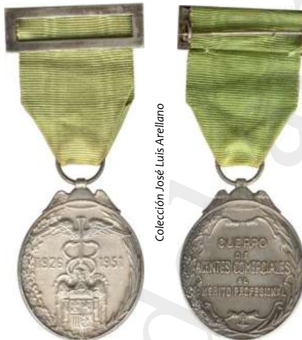
MEDALLA DE PLATA AL MÉRITO PROFESIONAL