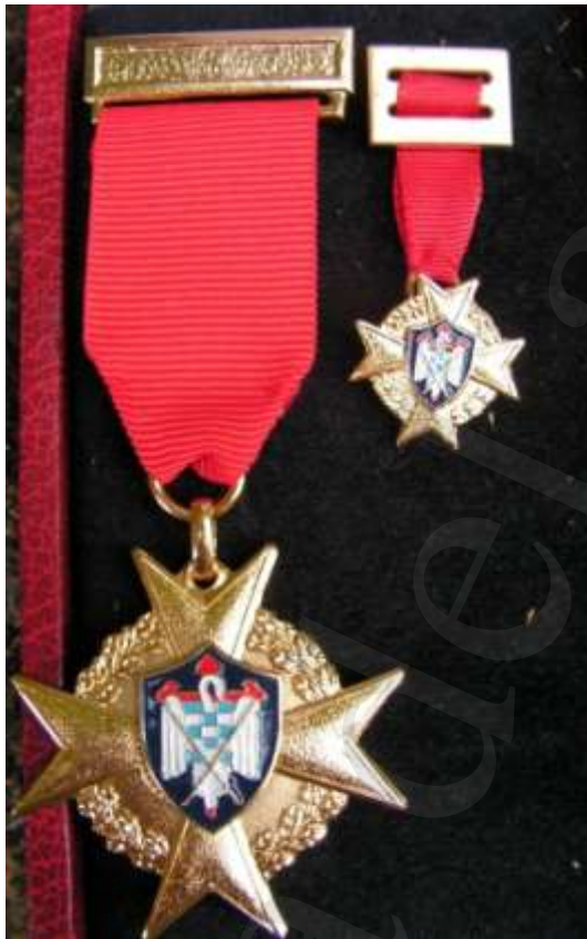
MEDALLA DE ORO