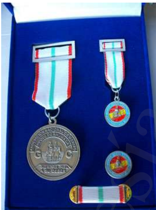
MEDALLA AL MÉRITO DISTINGUIDO