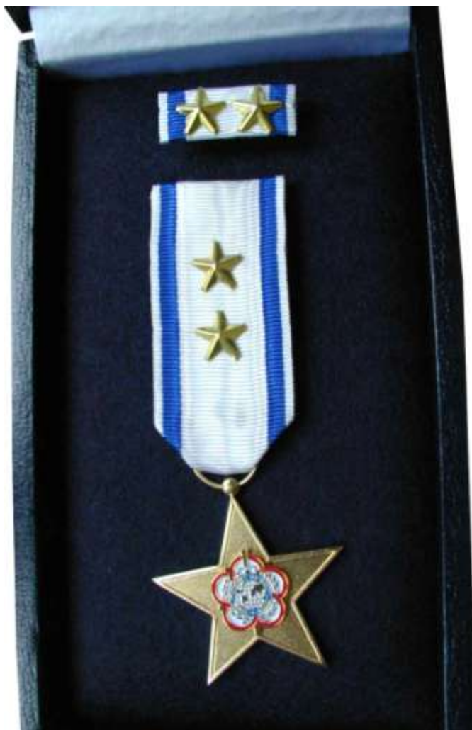
DOBLE ESTRELLA DE ORO