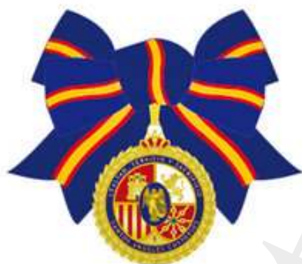
Lazo de dama