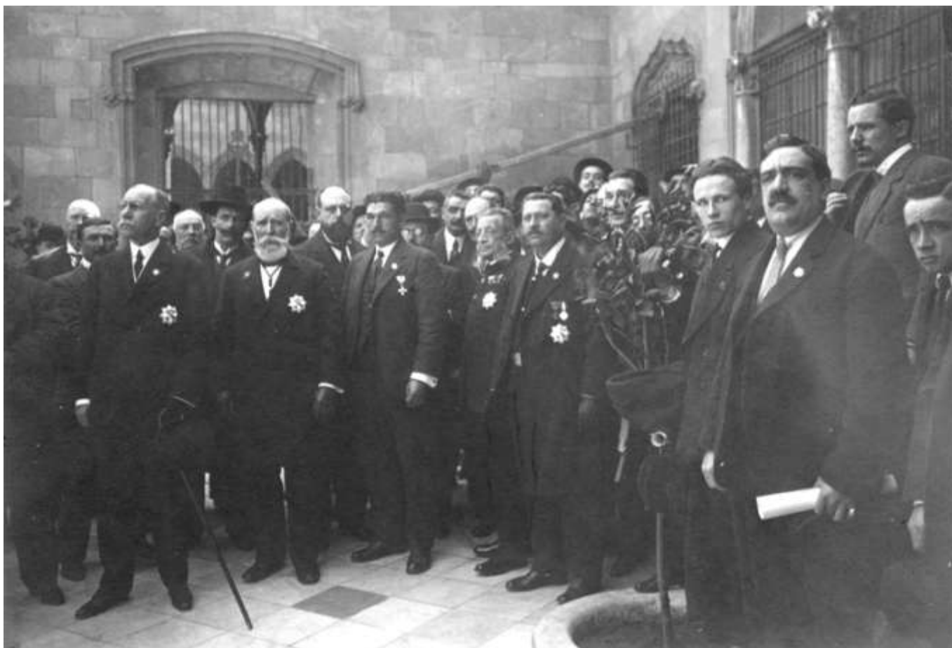
SOMATENES DE CATALUÑA Y CABOS DE DISTRITO PREMIADOS CON LA CRUZ DEL MÉRITO MILITAR POR LOS SERVICIOS PRESTADOS, 1 DE ENERO DE 1916