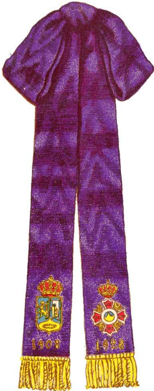
CORBATA DE LA CONSTANCIA