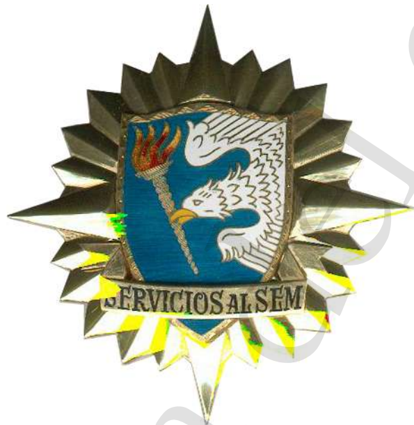
PLACA DE NÚMERO 26

Artículo doce. Todas las incidencias a que diere lugar el cumplimiento de esta Disposición, serán resueltas por la Jefatura Nacional del SEM.