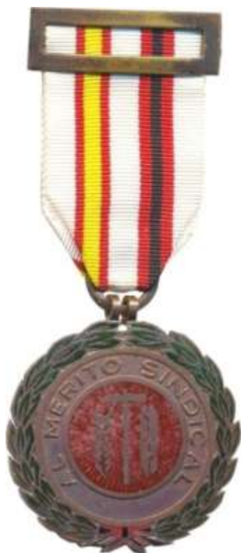
MEDALLA DE PRIMERA CLASE 1969-1971 19