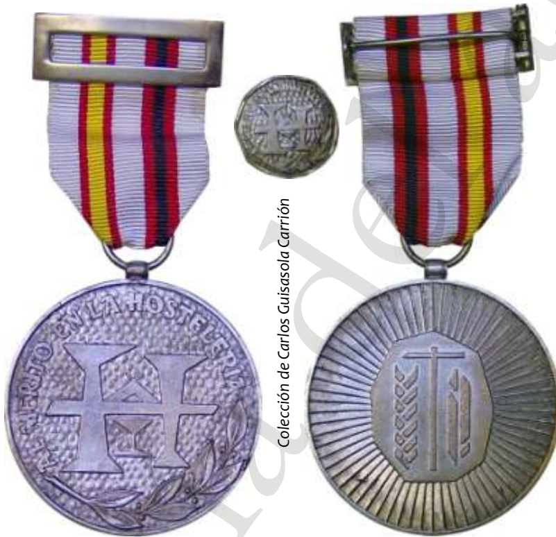
MEDALLA DE PLATA