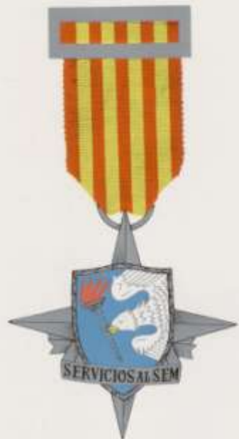
MEDALLA DE PLATA