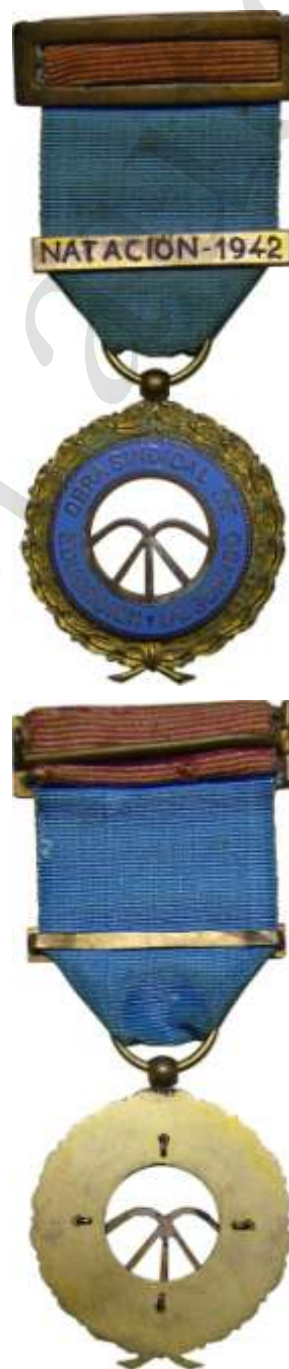
MEDALLA DE ORO PRIMER MODELO