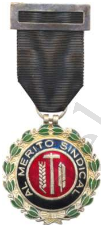
MEDALLA DE PLATA 1971