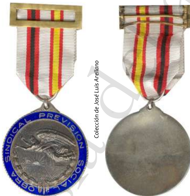
MEDALLA DE BRONCE