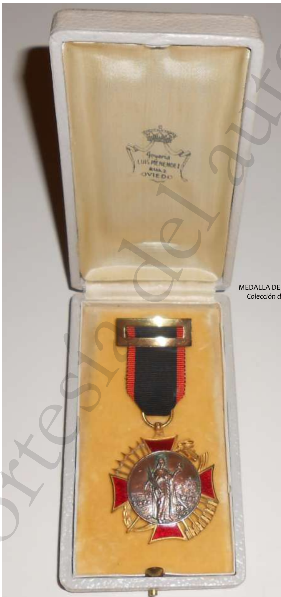
MEDALLA DE BRONCE Colección de ABB