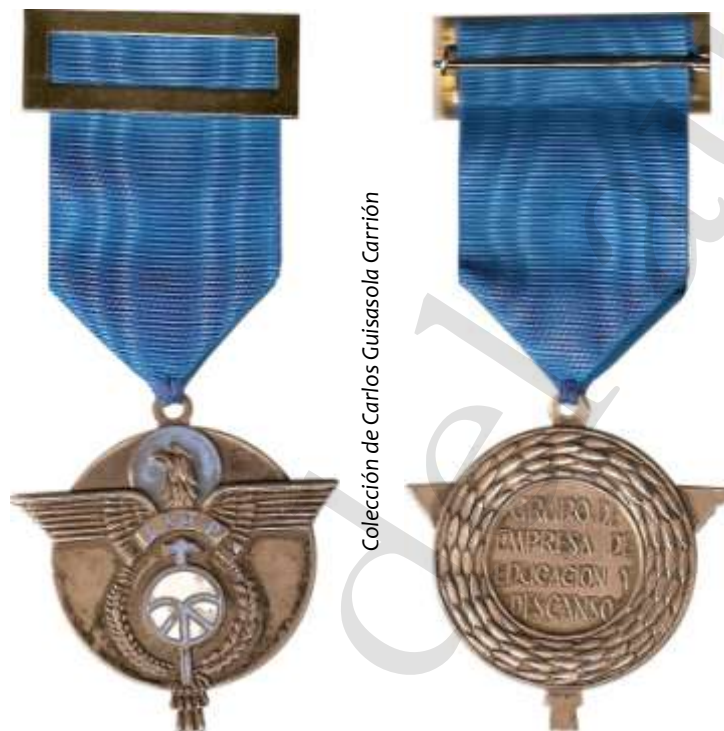
MEDALLA DE PLATA