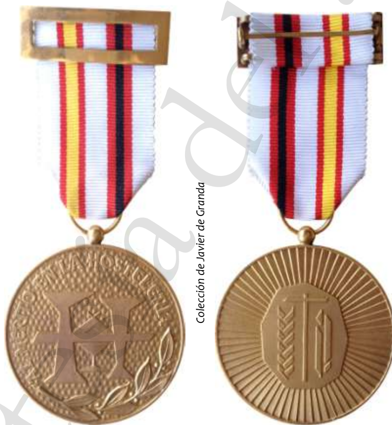
MEDALLA DE ORO

Su fabricante es Villanueva y Laiseca de Madrid.