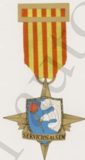
MEDALLA DE BRONCE