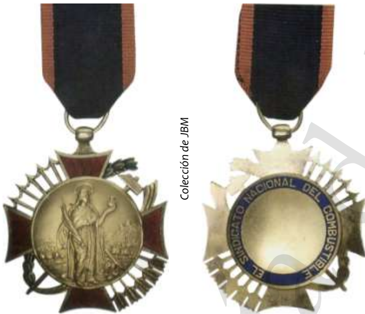
Colección de JBM