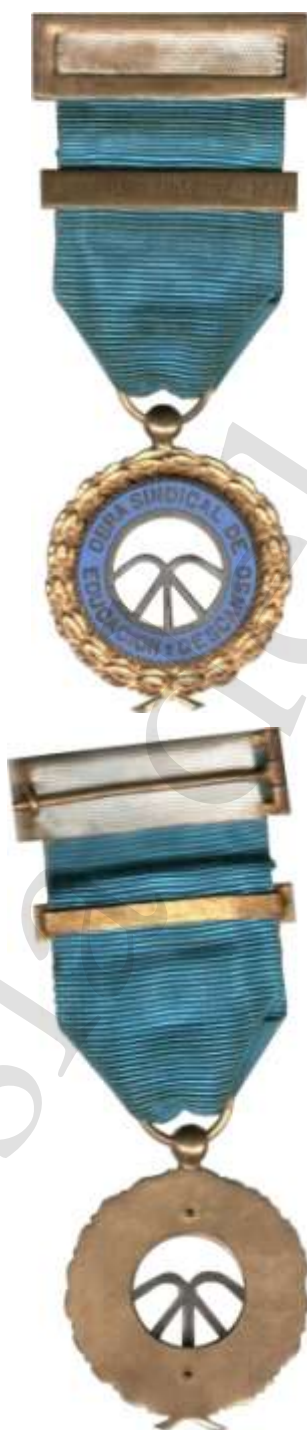
MEDALLA DE ORO PRIMER MODELO