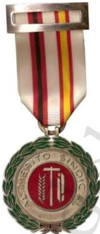
MEDALLA DE PLATA 1969-1971