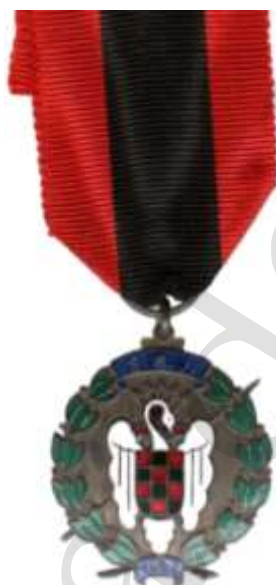
MEDALLA DE PLATA