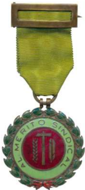
MEDALLA DE PRIMERA CLASE 1971