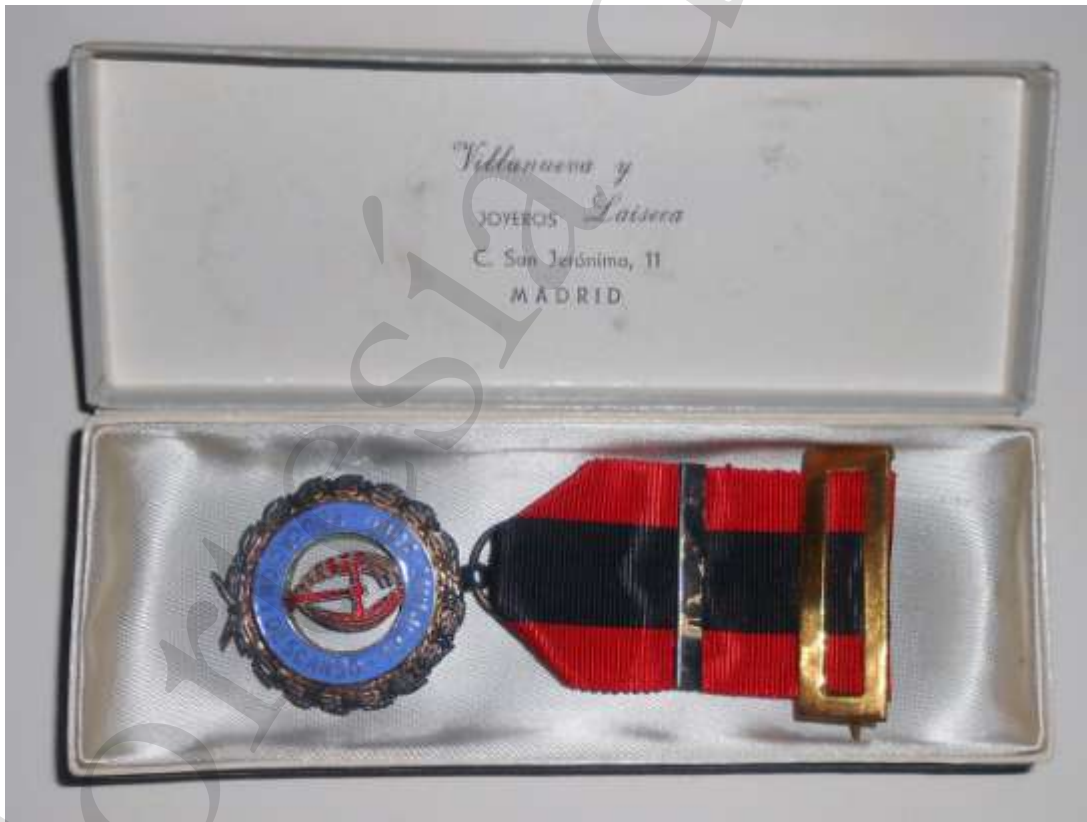
MEDALLA DE PLATA, SEGUNDO MODELO

Cualquier grupo de trabajadores superior a 50 miembros estaba amparado por la ley para constituirse en Obra sindical “Educación y Descanso”. Fue regulado un sistema de recompensas para premiar las actividades extraordinarias de sus afiliados, estableciendo la concesión de medallas de oro, plata y bronce a individuos o colectivos según su grado de participación en el enaltecimiento de la Obra [...] 3 .