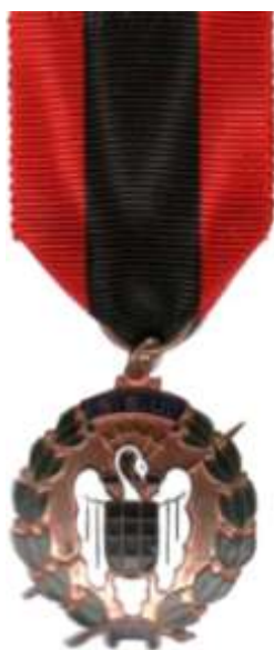
MEDALLA DE BRONCE