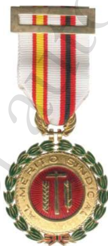
MEDALLA DE ORO 1969-1971 20