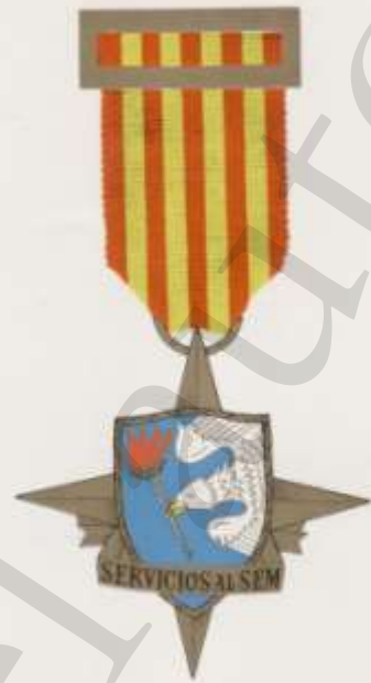
MEDALLA DE ORO