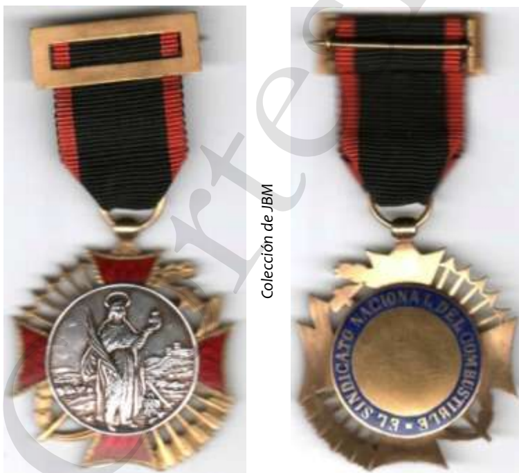
Colección de JBM