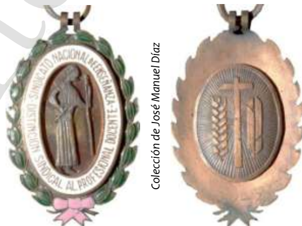
MEDALLA DE BRONCE

Medalla ovalada que en su centro lleva un medallón ovalado grabado con una Minerva. Lleva una orla de esmalte blanco con la inscripción SINDICATO NACIONAL DE ENSEÑANZA en la parte superior y DISTINCIÓN SINDICAL AL PROFESIONAL DOCENTE en la inferior. La medalla orlada de ramos de laurel esmaltados en verde atados en su parte inferior por un lazo carmesí. El reverso lleva el óvalo en el metal de la medalla con fondo rayado sobre el que aparece en relieve el emblema sindical. La cinta es de color carmesí.