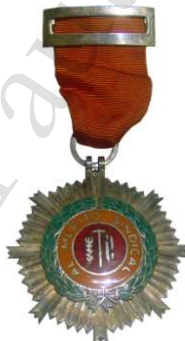
MEDALLA DE PLATA DISTINGUIDA 1971