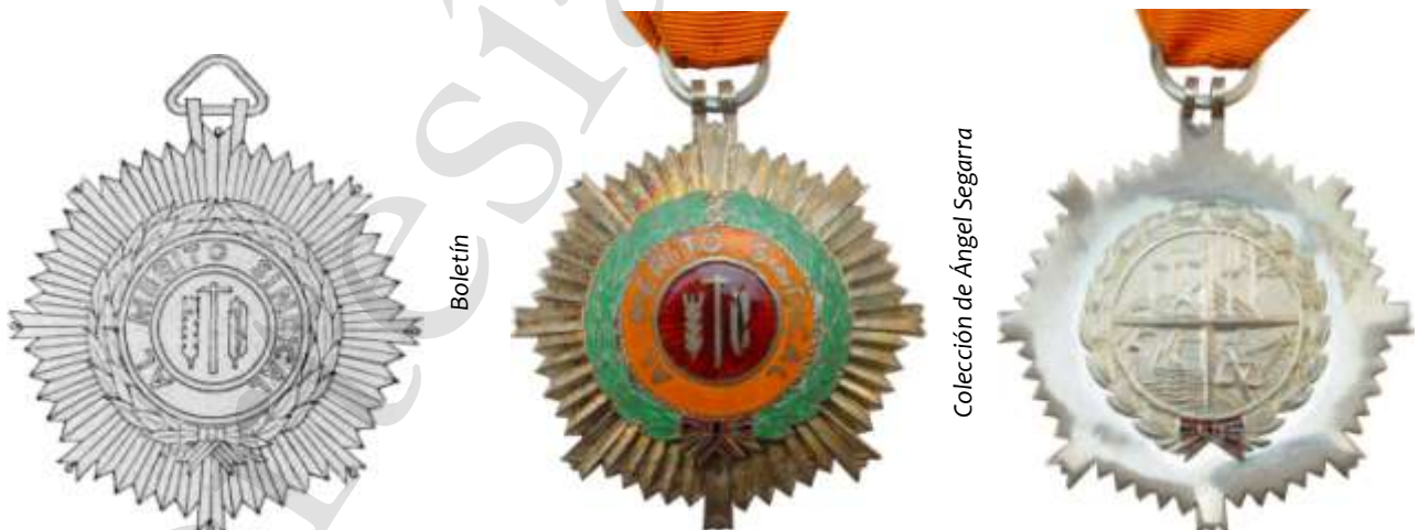
MEDALLA DE PLATA DISTINGUIDA, 1971