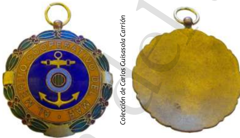
MEDALLA DE PLATA

Posiblemente concedida por la Unión Nacional de Cooperativas del Mar de España (UNACOMAR), asociación constituida en 1940, que representa a todas las cooperativas del mar de España.