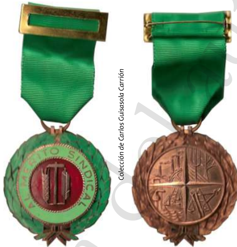
MEDALLA DE BRONCE DE PRIMERA CLASE, 1971

Decimocuarto. Se crea la Cancillería de la Medalla al Mérito Sindical, con Vicecanciller, que asistirá al Ministro de Relaciones Sindicales, Canciller y al Secretario General de la Organización Sindical, en las funciones relacionadas con esta distinción.