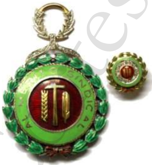
MEDALLA DE PRIMERA CLASE 22