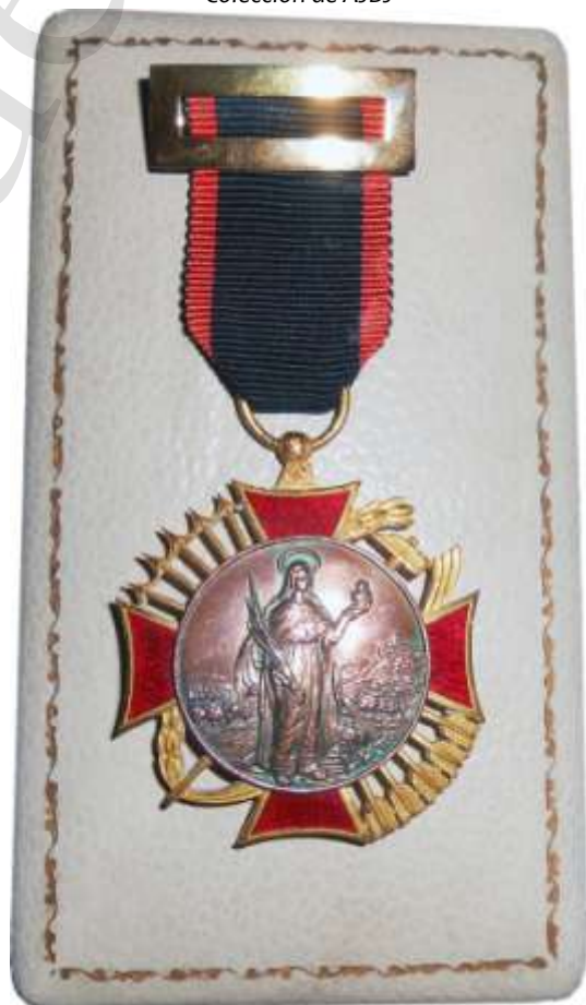
MEDALLA DE BRONCE Colección de AJBJ