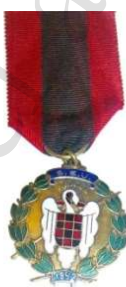
MEDALLA DE ORO