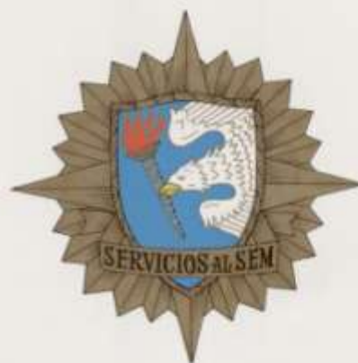
PLACA DE NUMERO