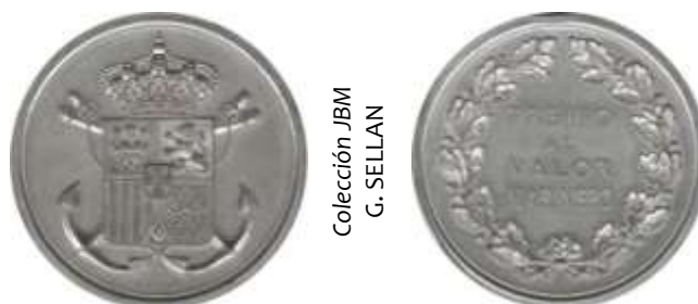
MODELO AMADEO DE SABOYA

En el reinado de Amadeo I se reforma, quedando el anverso con el escudo nacional, con el escudete de Saboya, con dos anclas cruzadas; en el reverso, corona de laurel con la inscripción al centro PREMIO · AL · VALOR · MARINERO.