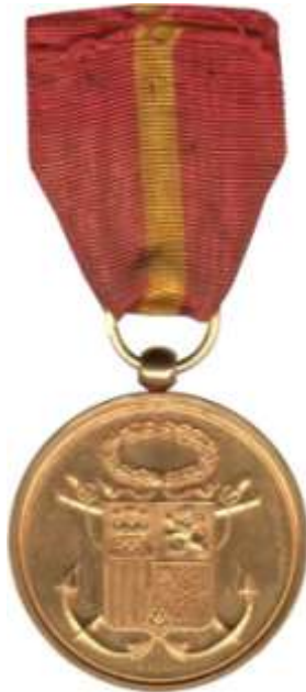
MODELO PRIMERA REPÚBLICA, MEDALLA DE ORO