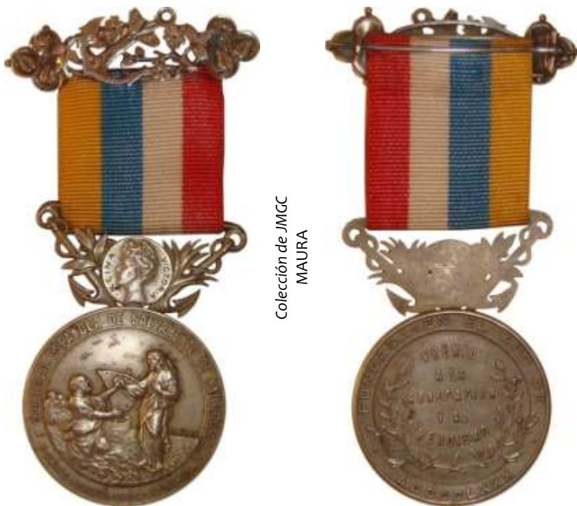
MEDALLA DE PLATA. MODELO 1906-1931