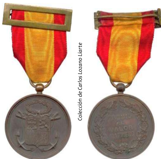
MODELO 1868 Y PRIMERA REPÚBLICA, MEDALLA DE BRONCE

La primera República suprime en el anverso el escudete de Saboya, sustituye la corona real por una cívica o de laurel, y adopta como cinta una roja con lista blanca.