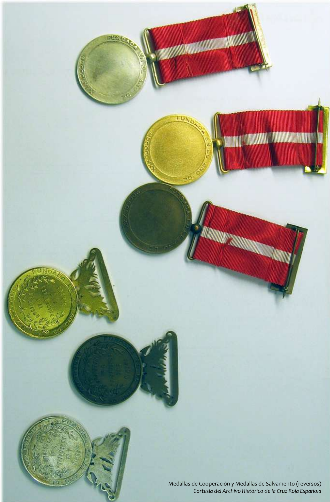
Medallas de Cooperación y Medallas de Salvamento (reversos)