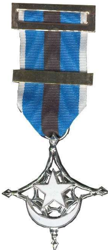
ZONA DE COMBATE