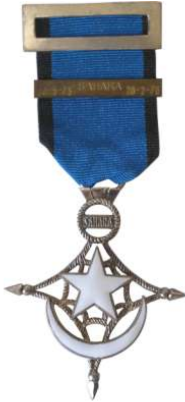
TEATRO DE OPERACIONES CON PASADOR SAHARA 20-5-73 28-2-76