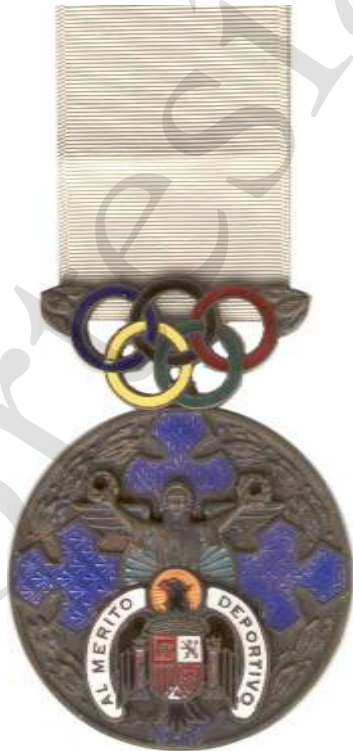
MEDALLA DE BRONCE, OTROS MÉRITOS