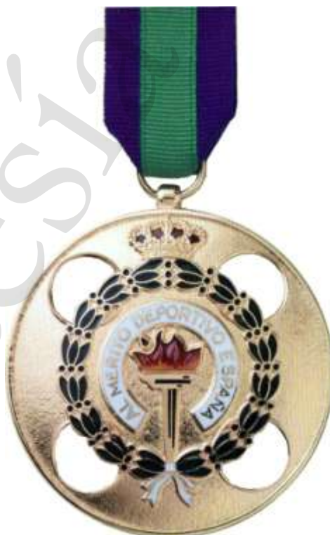
MEDALLA DE ORO