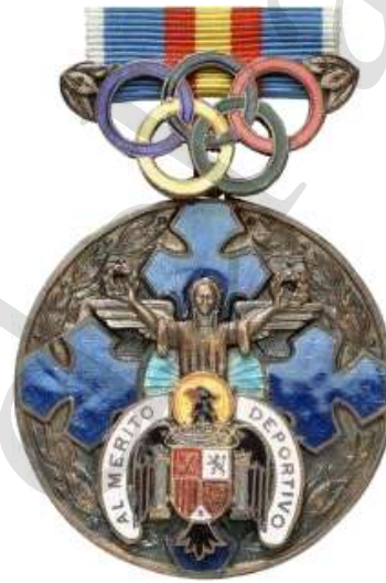
MEDALLA DE BRONCE, PRÁCTICA DEPORTIVA