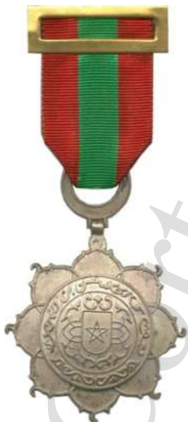
MEDALLA DE PLATA