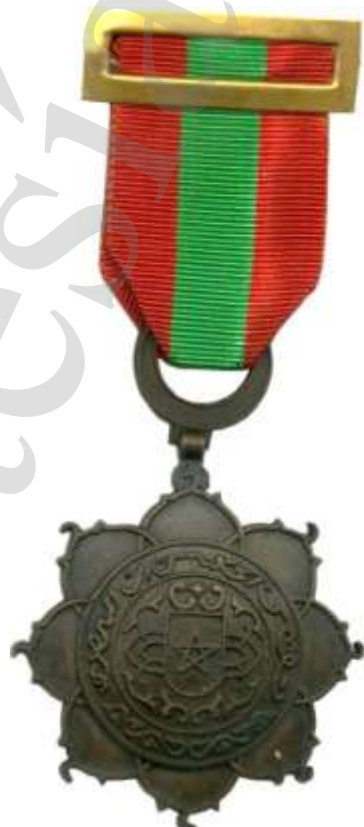
MEDALLA DE BRONCE