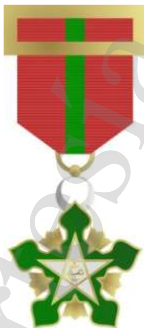
Infografía del autor