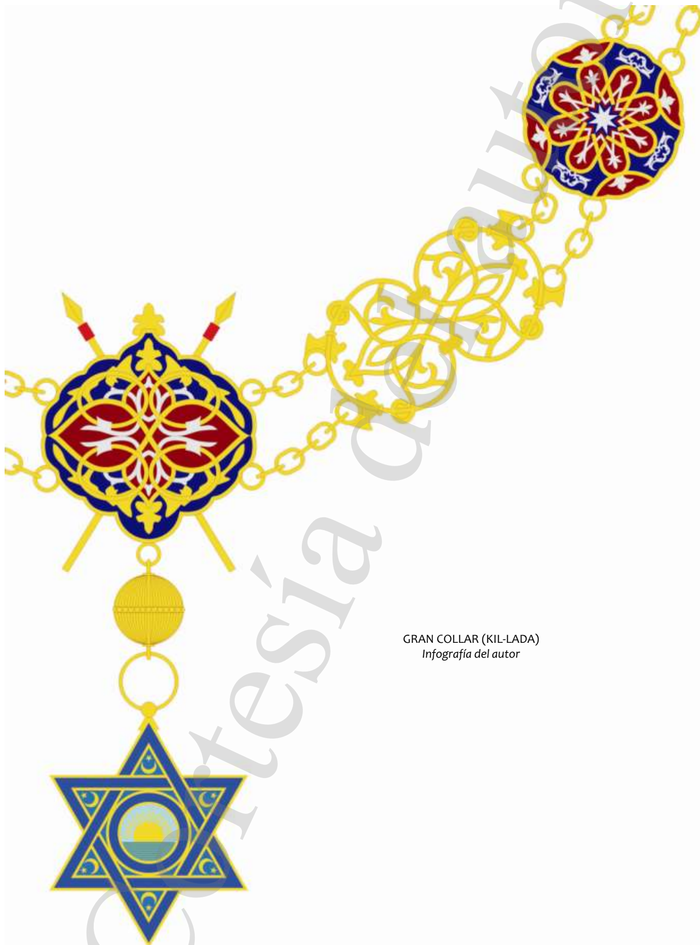
GRAN COLLAR (KIL-LADA) Infografía del autor