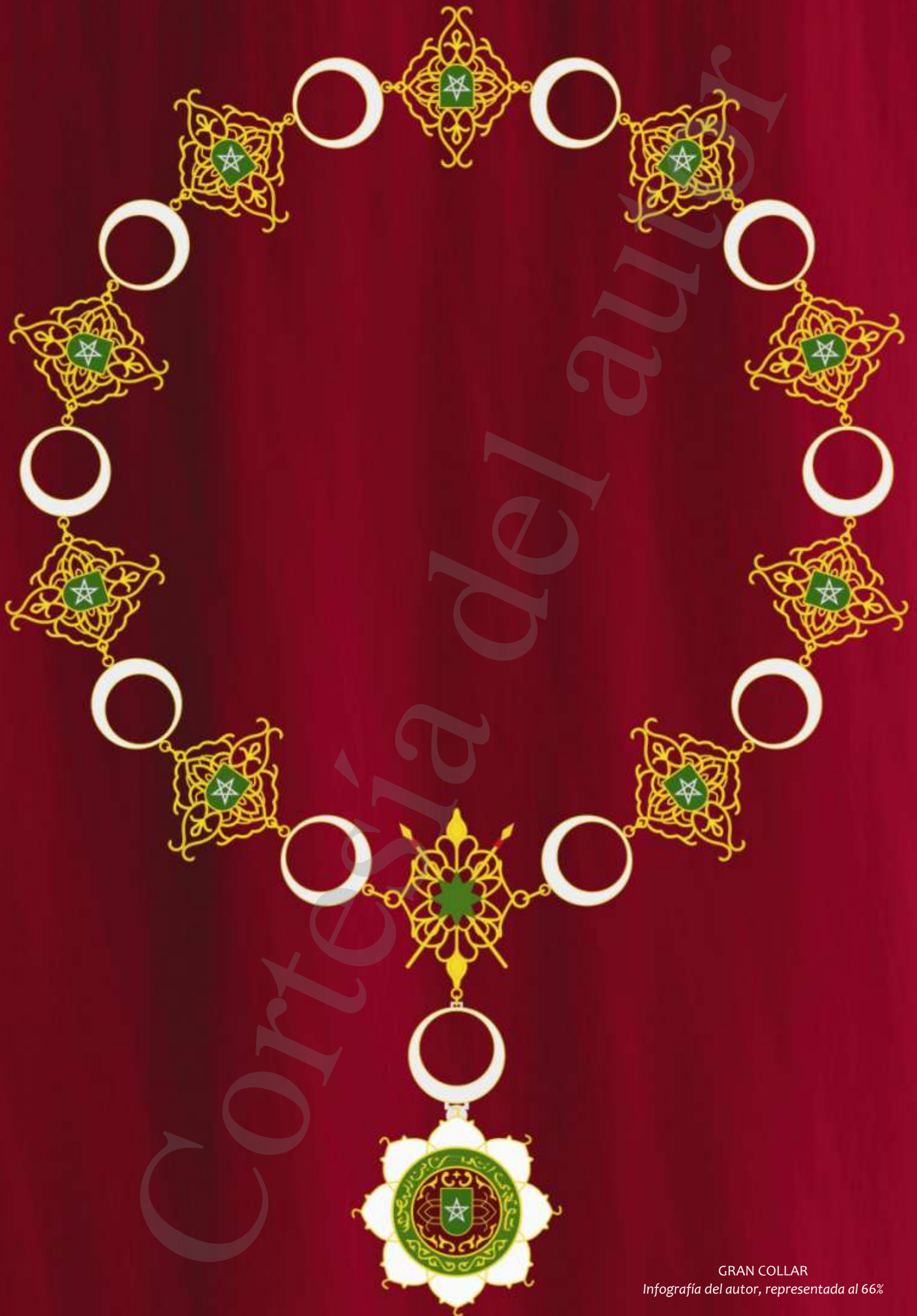
GRAN COLLAR Infografía del autor, representada al 66%