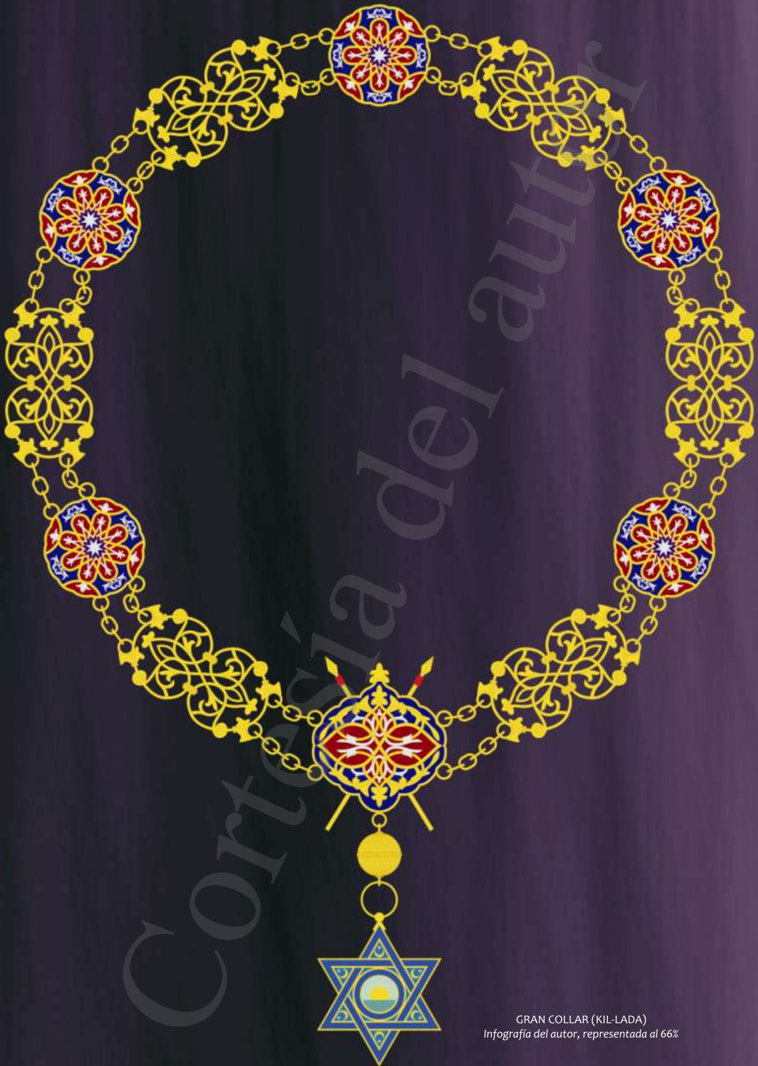
GRAN COLLAR (KIL-LADA) Infografía del autor, representada al 66%