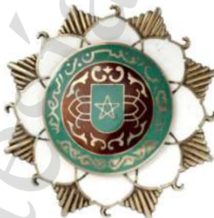
COMENDADOR DE NÚMERO (FAJAMA)