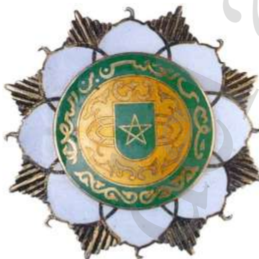
PLACA DE LA GRAN CRUZ (SUMU-U)

Artículo 13. Corresponde a la Cancillería de la Orden de la Hasania la ejecución de las disposiciones del presente Reglamento, resolviendo las dudas que en su interpretación puedan suscitarse 22 .