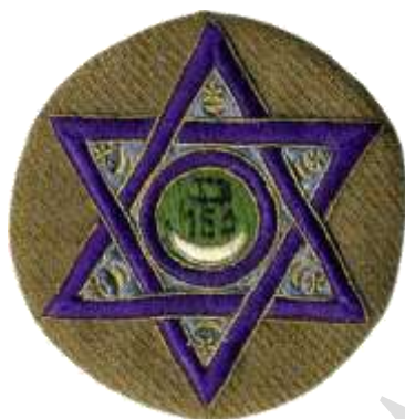
Colección Carlos Lozano