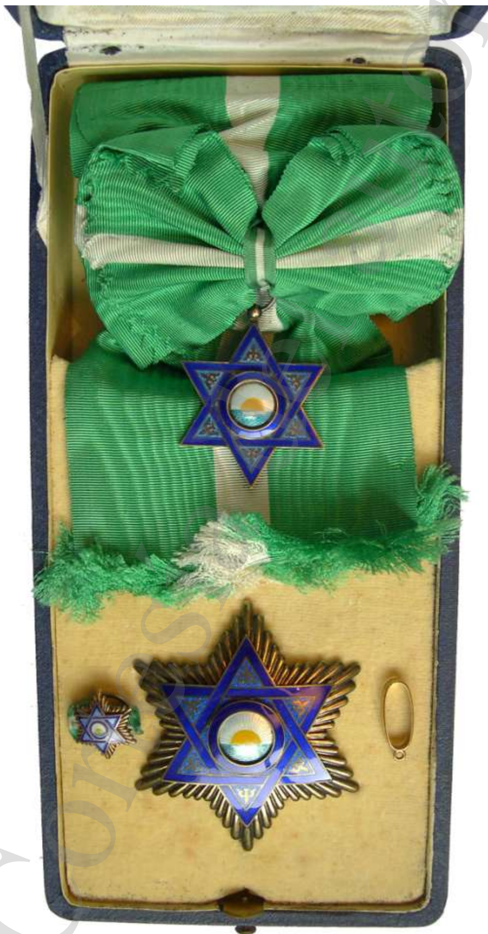
GRAN CRUZ (SUMU-U)