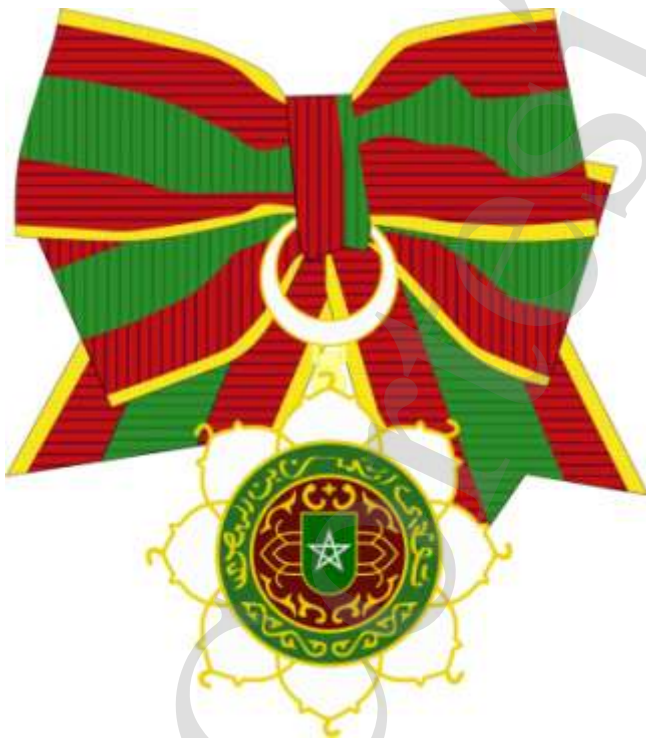
Infografía del autor