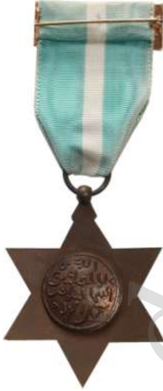
PENDIENTE DE CUELLO (USO NO OFICIAL)