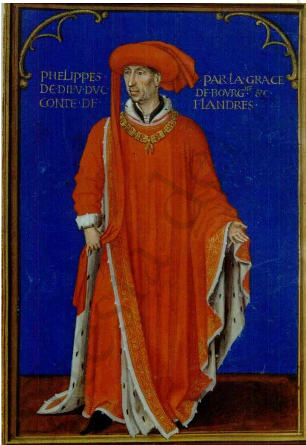
Felipe III, duque de Borgoña, Jefe y Soberano de la Insigne Orden del Toisón de Oro