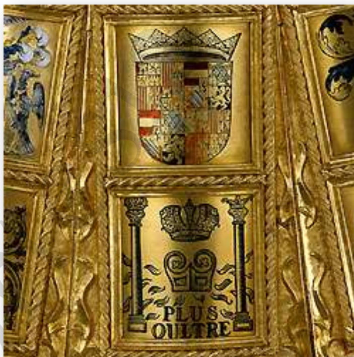
Collar del Rey de Armas de la Insigne Orden, denominado Potence, con las armerías de los caballeros vivos en cada momento. Viena, Tesoro del Toisón de Oro, depositado en el Kunsthistorische Museum