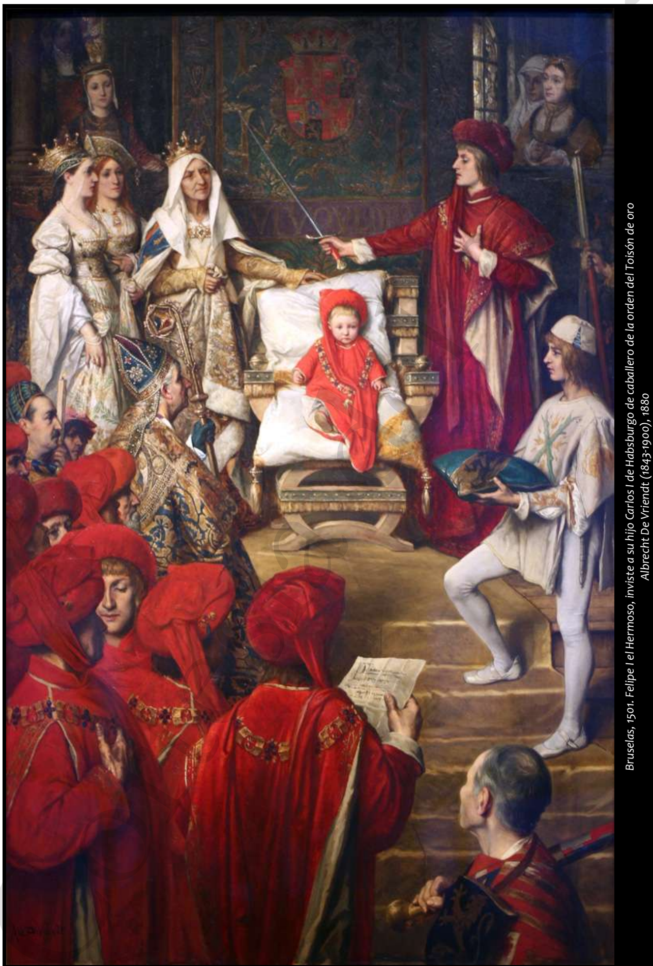
Bruselas, 1501. Felipe I el Hermoso, inviste a su hijo Carlos I de Habsburgo de caballero de la orden del Toisón de oro Albrecht De Vriendt (1843-1900), 1880