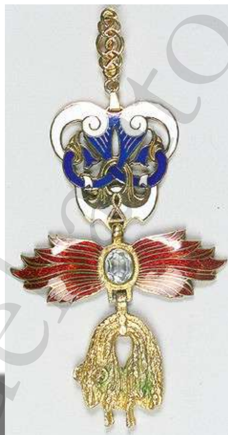
Hermann Historica München