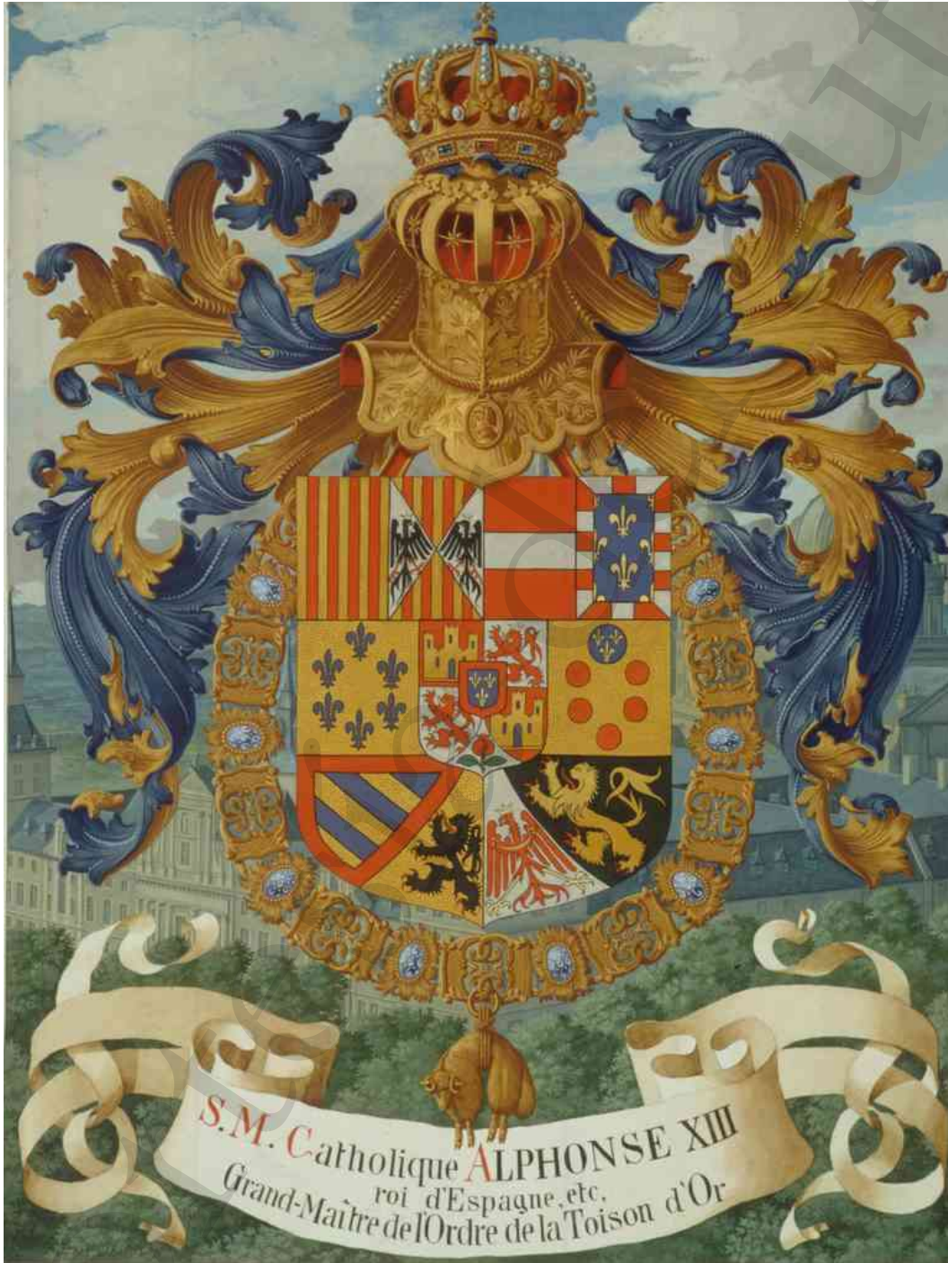
Escudo de Alfonso XII