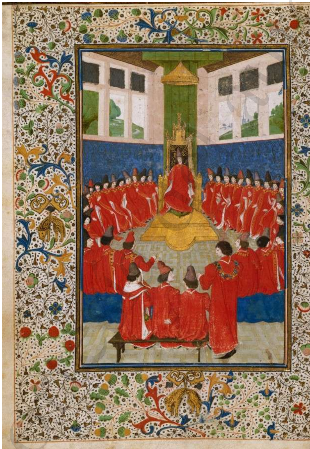
Estatutos y armorial del Toison de Oro. Circa 1468