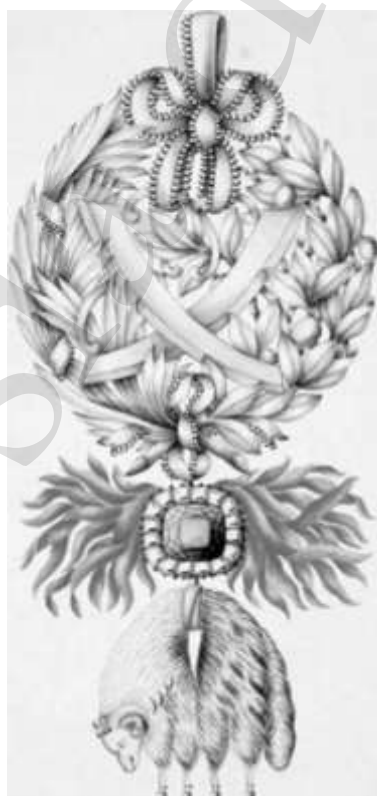
Diseño de corbata de la Orden del Toisón de oro 192