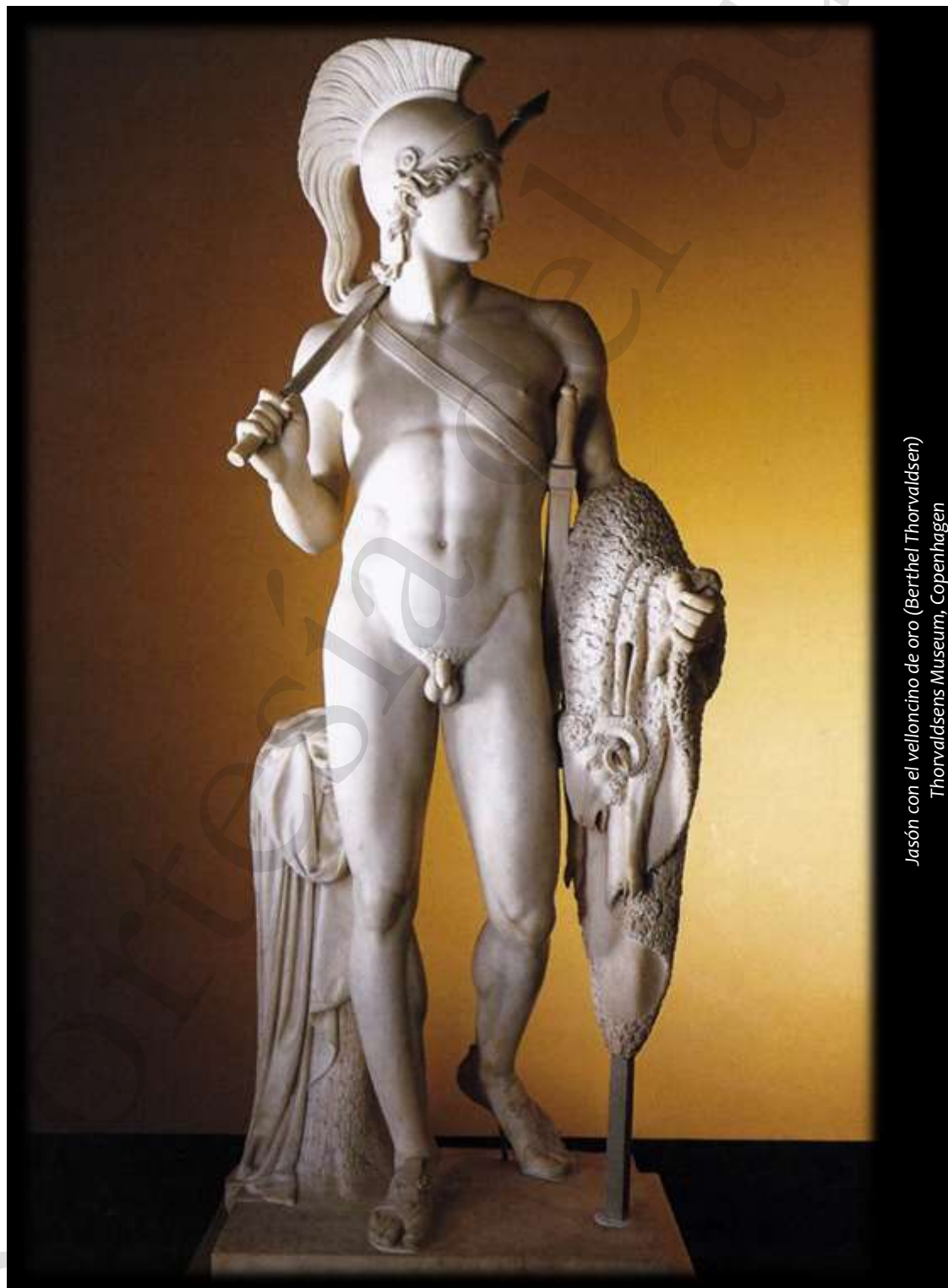
Jason con el velloncino de oro (Berthel Thorvaldsen) Thorvaldsens Museum, Copenhagen

S. M. el Rey, Jefe y Soberano de la Insigne Orden del Toisón de Oro, se ha dignado disponer que sus Caballeros traigan el Collar de la misma todos los días preceptuados anteriormente y siempre que asistan a actos y ceremonias en el Salón del Trono, a los de apertura de las Cortes y a todos aquellos cuya solemnidad lo requiera, previo aviso al efecto.