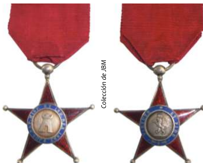
CRUZ DE CABALLERO 1