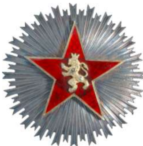
GRAN CRUZ 2