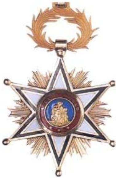
CRUZ DE SEGUNDA CLASE

Enterada la reina de la consulta elevada por ese Ministerio de la Guerra con fecha 12 de agosto último, para que se manifieste si los condecorados con la cruz de la Orden Civil de la Beneficencia ya sean paisanos o bien pertenezcan a las clases de tropa del Ejército, han de usar o no el dictado de don antes de su nombre, se ha dignado resolver que todos los condecorados con la cruz de la Orden expresada tienen el tratamiento de don por el solo hecho de concedérselo S. M. en la real orden de concesión y de estamparse así en el diploma que, para usar tan honroso distintivo, se expide por este ministerio.