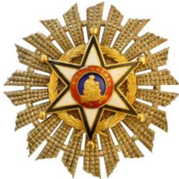
CRUZ DE PRIMERA CLASE