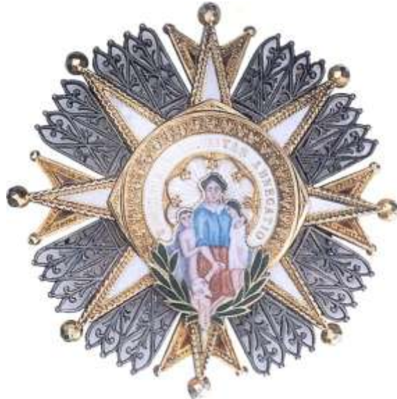
DISTINTIVO BLANCO, GRAN CRUZ