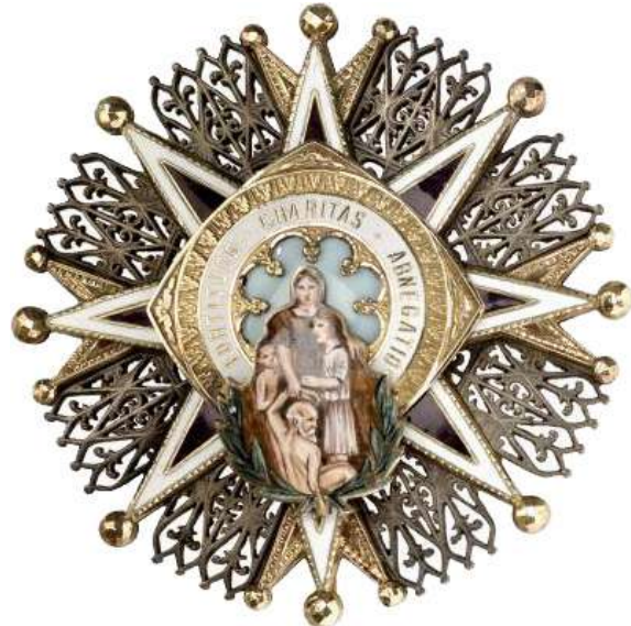
DISTINTIVO MORADO Y BLANCO, GRAN CRUZ