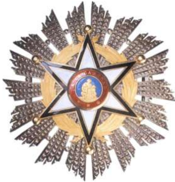
CRUZ DE PRIMERA CLASE