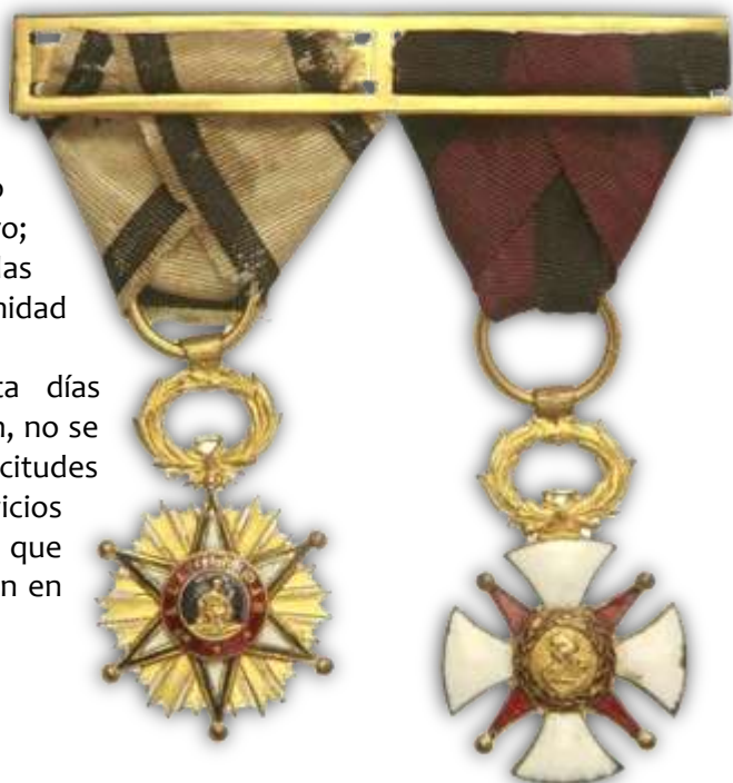
PASADOR CON CRUCES DE BENEFICENCIA Y DE EPIDEMIAS

4.º Trascurridos que sean treinta días desde la publicación de esta real orden, no se admitirán, bajo ningún pretexto, solicitudes en demanda de recompensa por servicios prestados en las calamidades públicas, que desgraciadamente afligieron a la nación en los años de 1854 y 55.