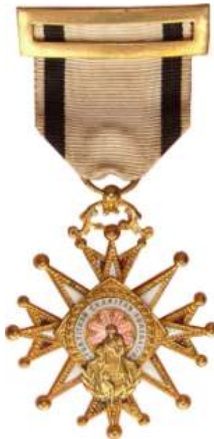
DISTINTIVO BLANCO Y NEGRO CRUZ DE TERCERA CLASE