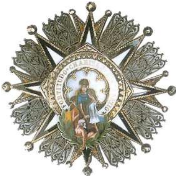
DISTINTIVO BLANCO Y NEGRO, GRAN CRUZ