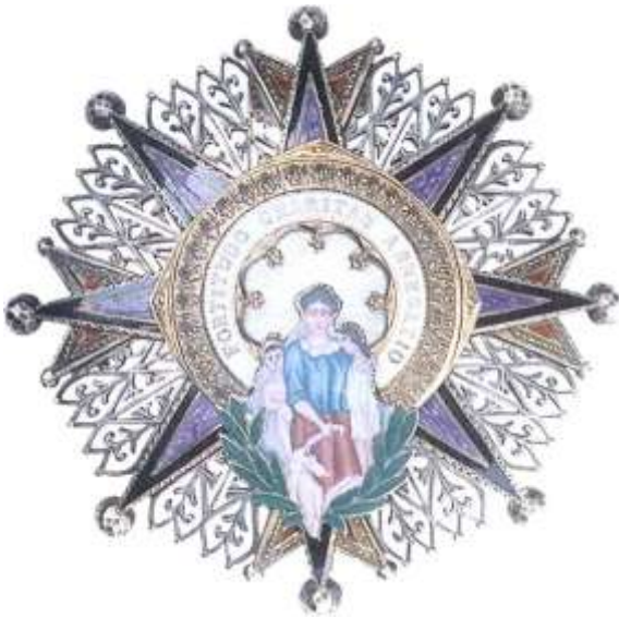
DISTINTIVO MORADO Y NEGRO, GRAN CRUZ