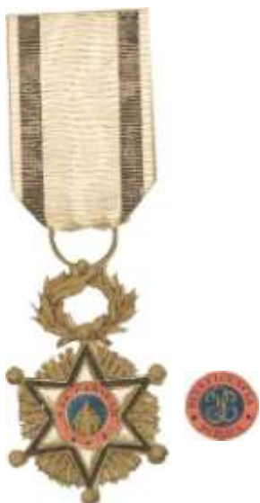
CRUZ DE TERCERA CLASE Y REVERSO