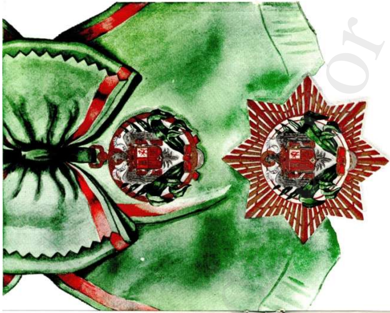
Orden de Africa