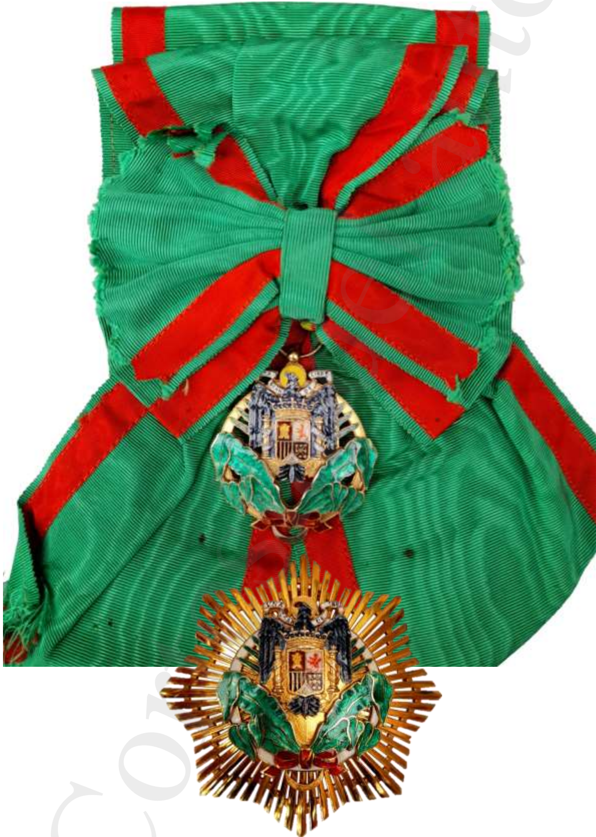
GRAN OFICIAL: PLACA, BANDA DE LA GRAN CRUZ Y VENERA