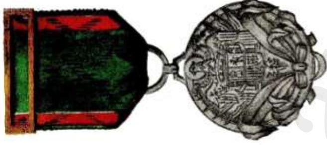
Medalla de Plata