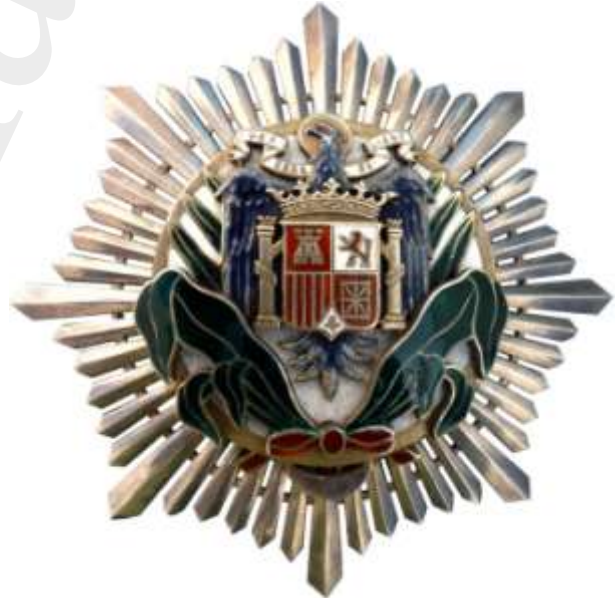
COMENDADOR CON PLACA (PLACA)