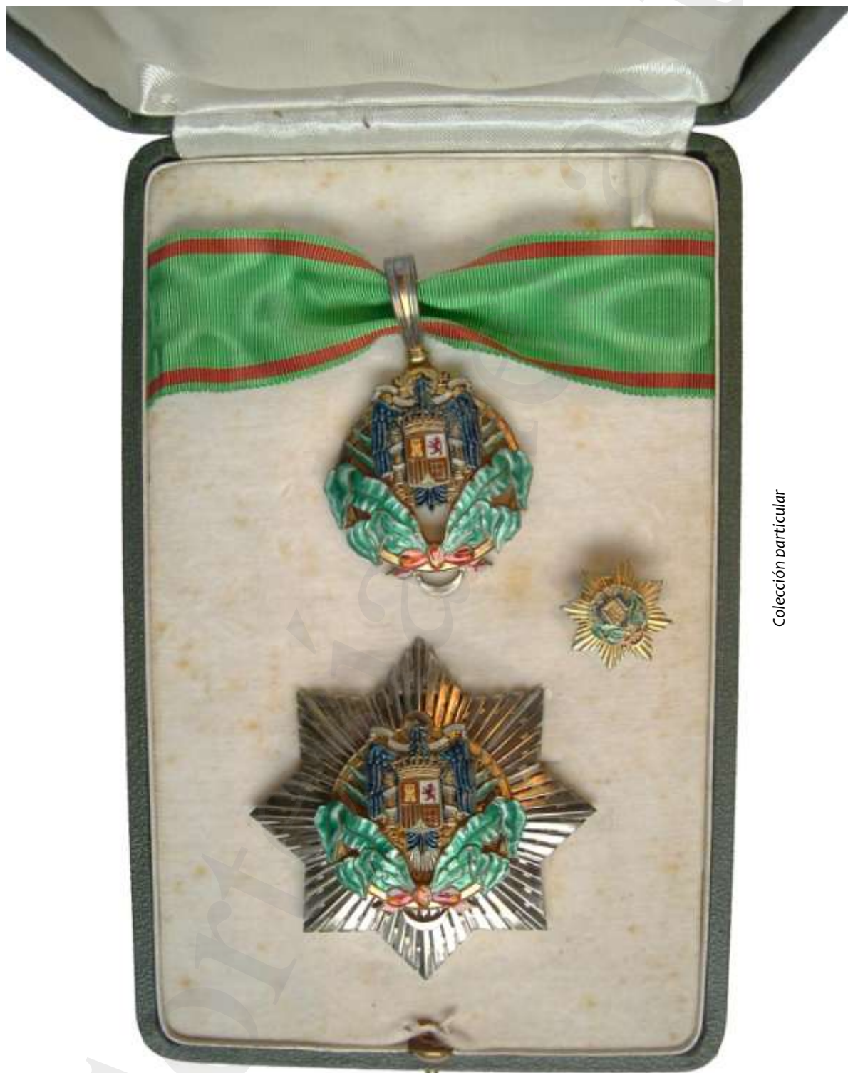
COMENDADOR CON PLACA, 1951