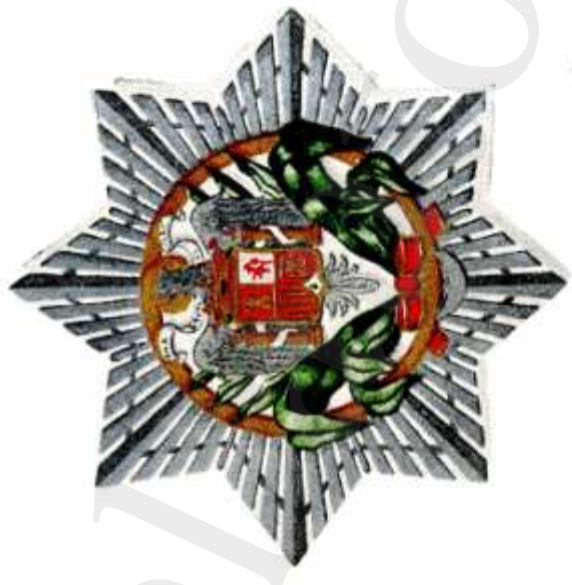
Comendador con Placa