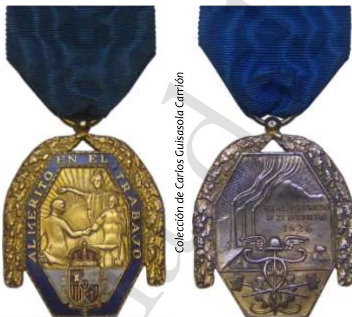
MEDALLA DE ORO DE 1ª CATEGORÍA