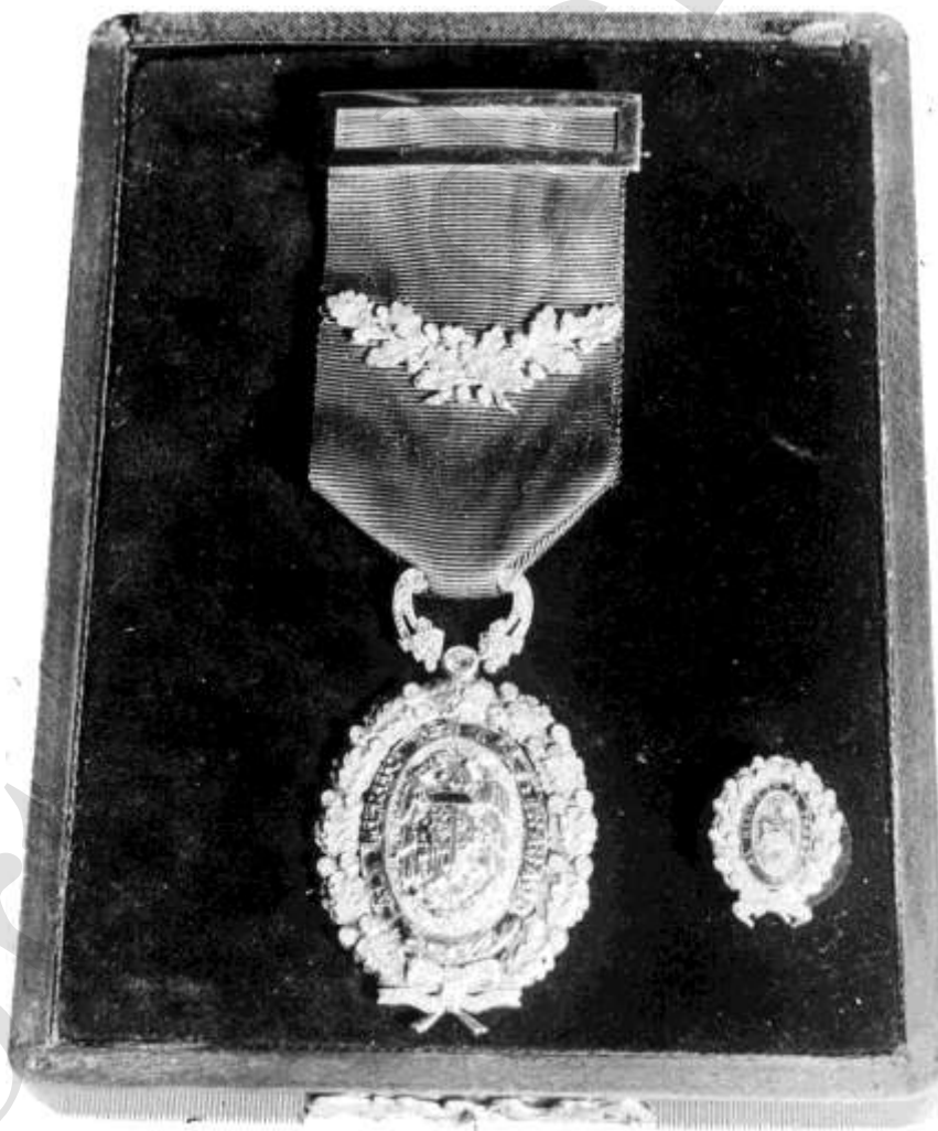
MEDALLA DE PLATA CON RAMAS DE ROBLE, 1960

El decreto de 14 de marzo de 1942, que restableció la Medalla del Trabajo, y las órdenes de 25 de abril de 1942, 14 de diciembre de 1942, 12 de mayo de 1943, 26 de junio de 1943 y 5 de agosto de 1943.