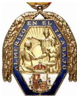
MEDALLA DE ORO DE 1ª CATEGORÍA

Artículo 26. Por disposición especial se determinarán las bases del concierto a que se refieren los artículos 15, 16, 17 y 18, previo informe del Instituto Nacional de Previsión 2 .