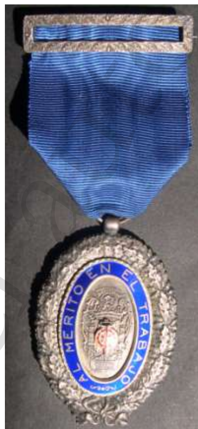
MEDALLA DE PLATA DE PRIMERA CLASE