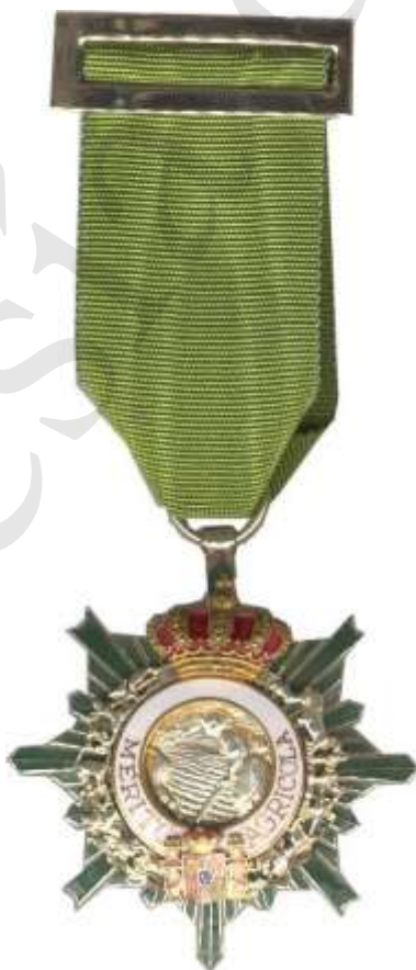
CABALLERO MODELO POSTERIOR A 1981