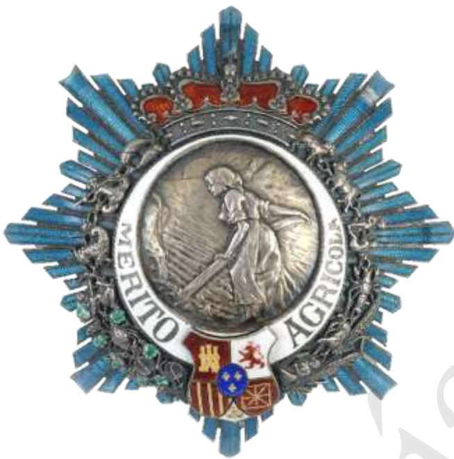
Colección particular FERNÁNDEZ