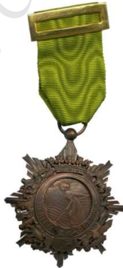
MEDALLA DE BRONCE