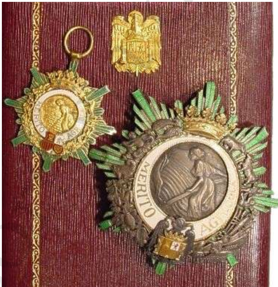
GRAN CRUZ (VENERA Y PLACA)