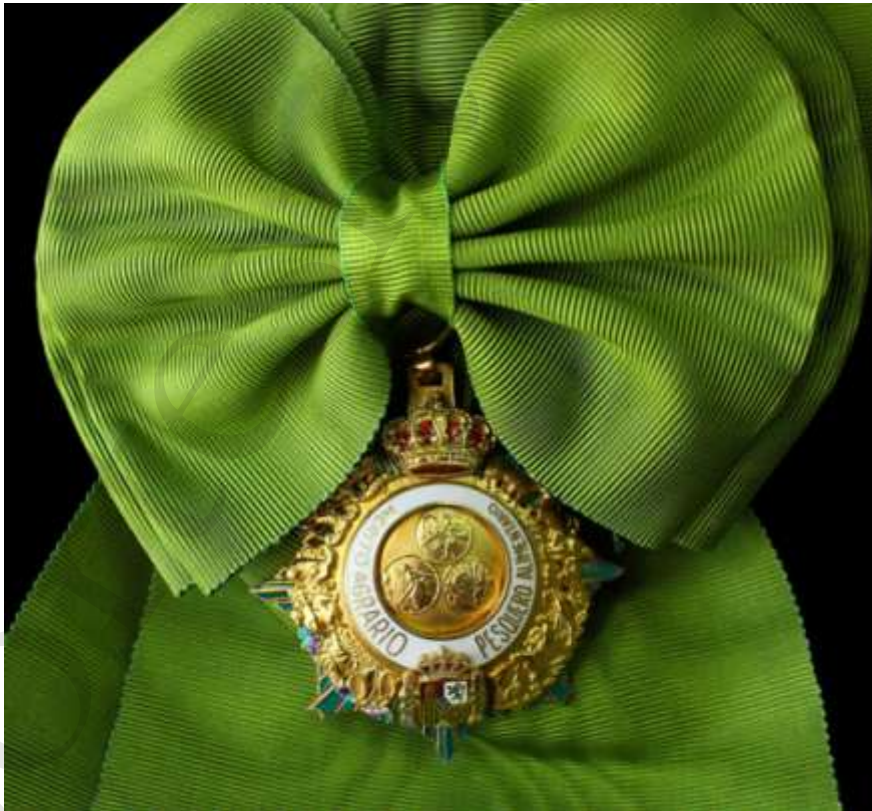
ROSETÓN DE LA BANDA DE LA GRAN CRUZ MÉRITO AGRARIO, PESQUERO Y ALIMENTARIO