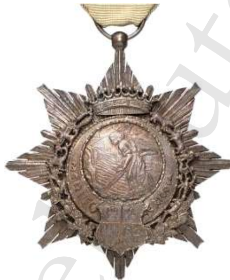
MEDALLA DE BRONCE