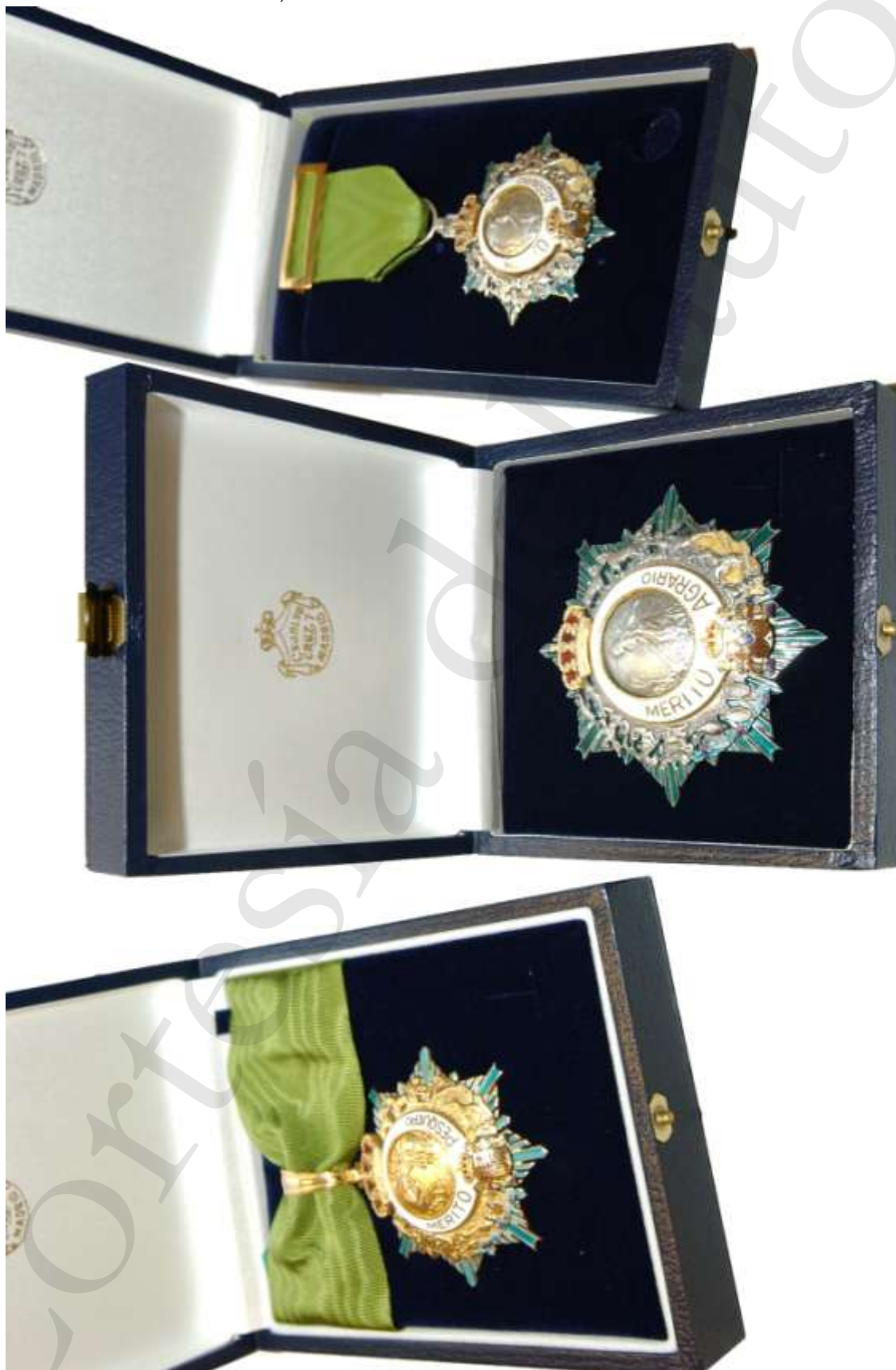
COMENDADOR, PLACA DE COMENDADOR Y CRUZ DEL MÉRITO AGRARIO