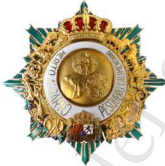
GRAN CRUZ. PLACA MÉRITO AGRARIO, PESQUERO Y ALIMENTARIO