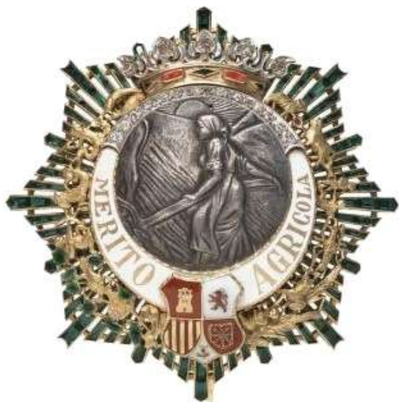
Colección particular CEJALVO