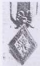
Medalla de Distinción de Baylén, 1808. Modelo esmaltado.