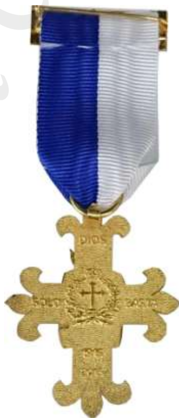
Colección de JABT