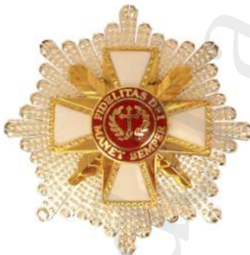
ENCOMIENDA DE LA CRUZ FIDÉLITAS (2ª CLASE)