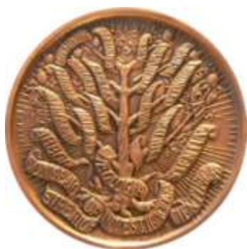
MEDALLA 45 MM.