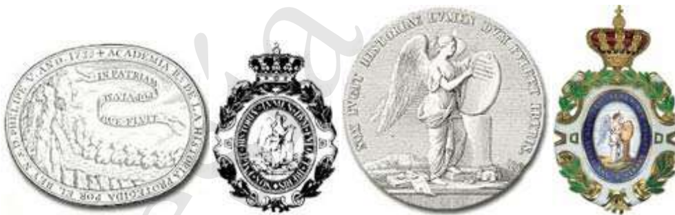
Emblema antiguo; Emblema de la Corporación, Sello mayor; Medalla de la RAH

La medalla académica la impone el Director en el acto solemne y público de la recepción de cada nuevo Numerario. La medalla es obligatoria en las sesiones públicas y en todos los actos a los que se concurra en corporación o representación de la Academia.