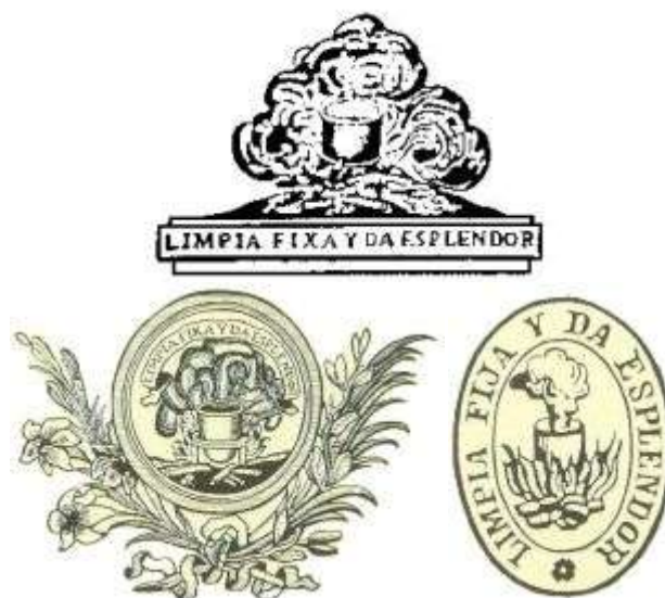
Emblemas de la Corporación de 1777, 1868 y 1771

Se instituye la Placa de la Real Academia Española en las categorías de oro y de plata, que podrá otorgarse a personas o instituciones como reconocimiento por su ayuda a las actividades de la Academia.