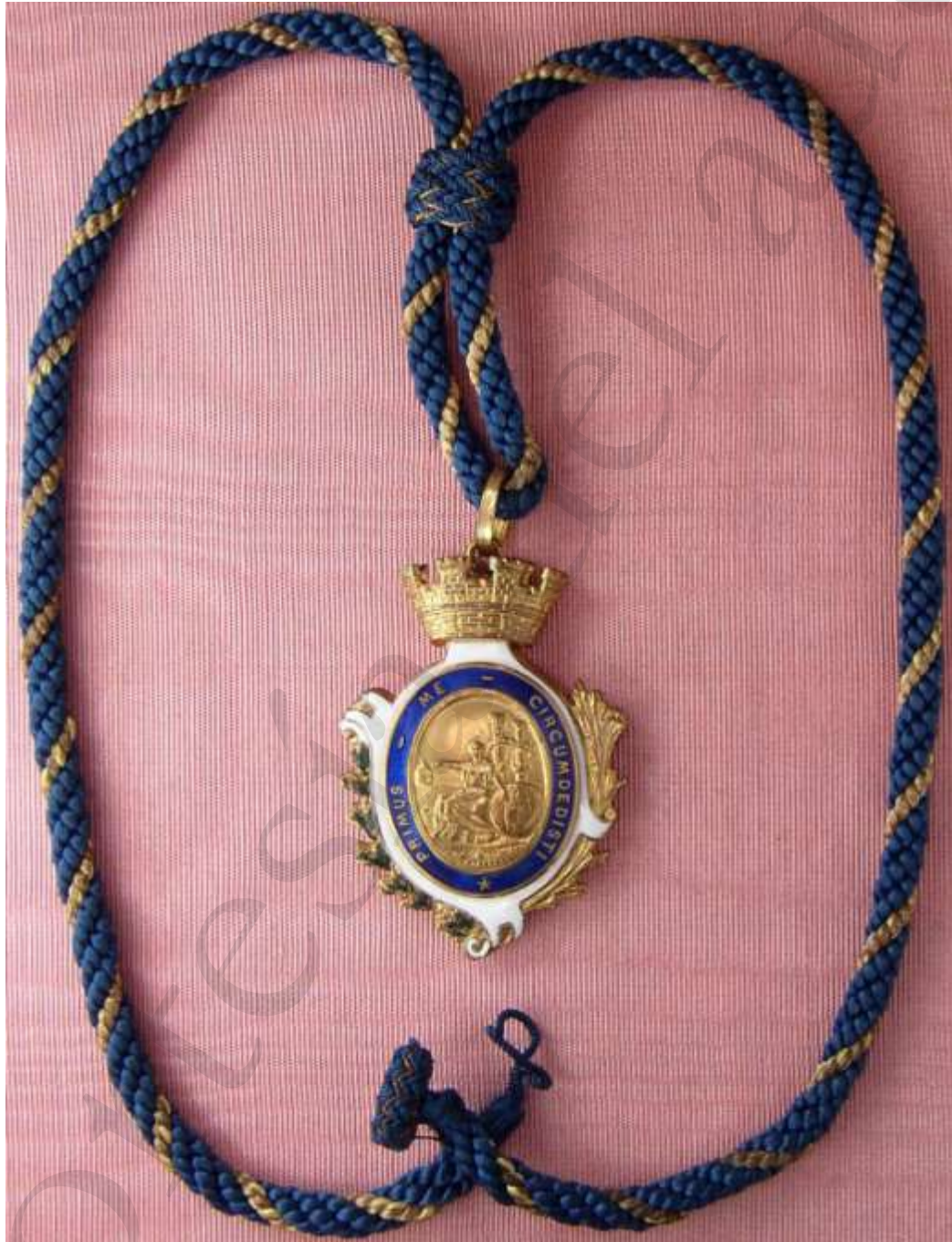
Colección de Johan Deville