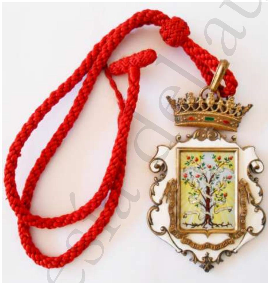
MEDALLA DE VOCAL