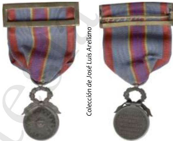
Colección de José Luis Arellano

Artículo único. Concedo a los individuos que componen la Sociedad filantrópica de Milicianos Nacionales Veteranos el uso de una medalla, que podrán llevar como distintivo en el traje particular o en el propio de su instituto; sujetándose en la forma y dimensiones de aquella al modelo propuesto por la junta de gobierno de la misma sociedad en 18 de junio último.