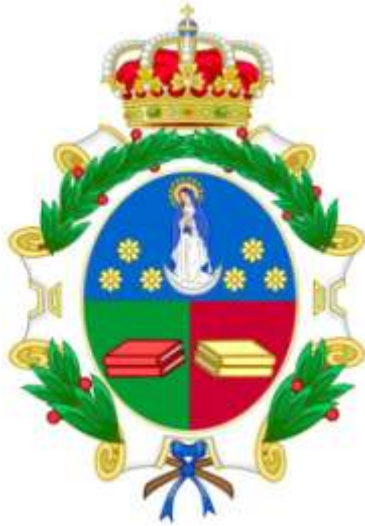
Real Academia de Jurisprudencia y Legislación