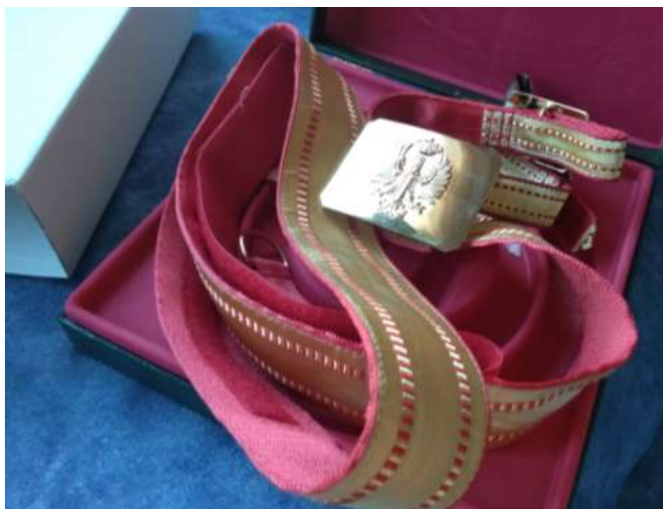
ARMADA. INFANTERÍA DE MARINA