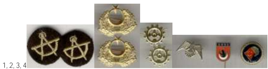
1, 2, 3, 4