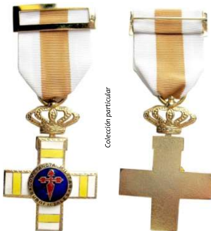
MODELO 1978. CRUZ PENSIONADA