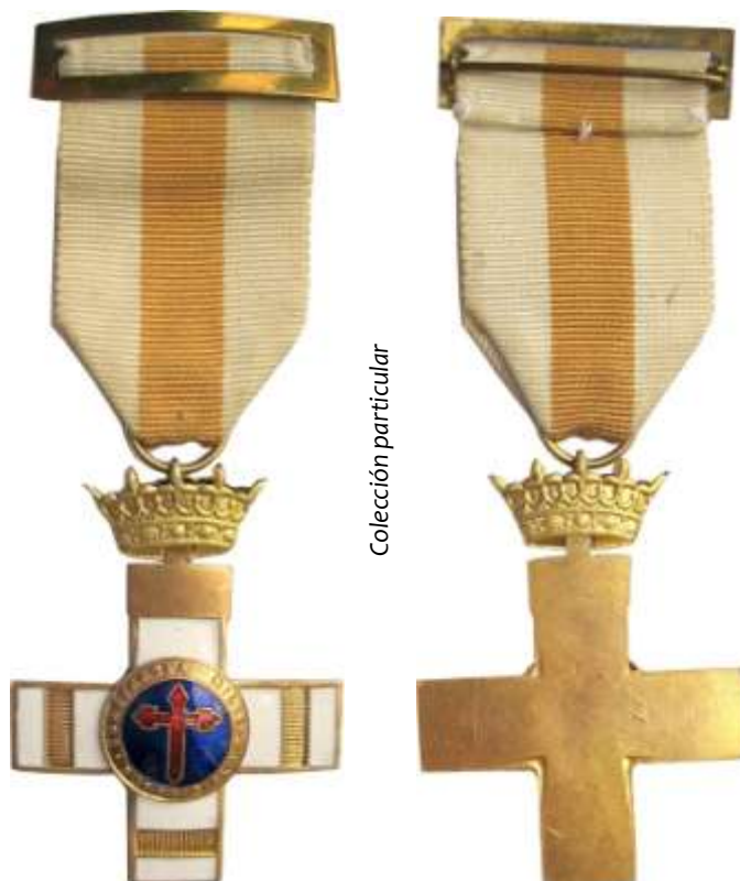
MODELO 1958. CRUZ PENSIONADA. BARRAS EN TRES BRAZOS 2