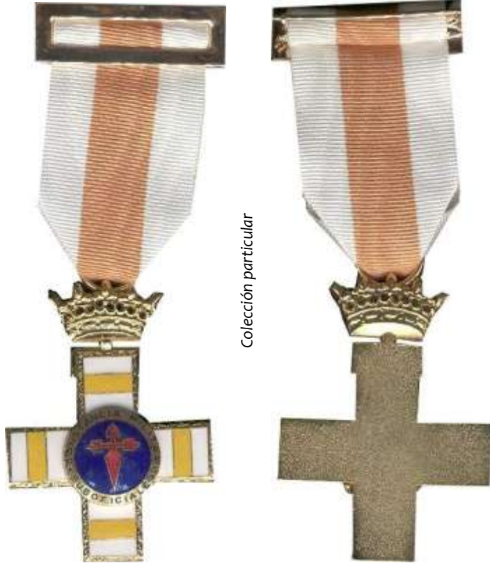
MODELO 1958. CRUZ PENSIONADA