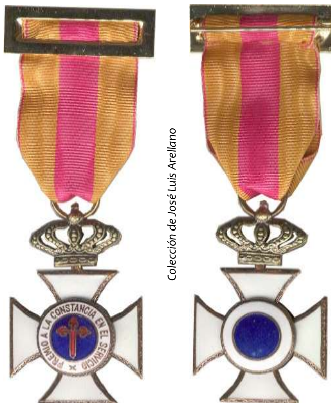
CRUZ DE LA CONSTANCIA EN BRONCE