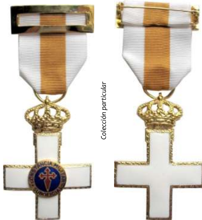
MODELO 1978. CRUZ SIN PENSIÓN

«Contra la resolución que se dicte podrá interponerse recurso de reposición previo al contencioso-administrativo.»