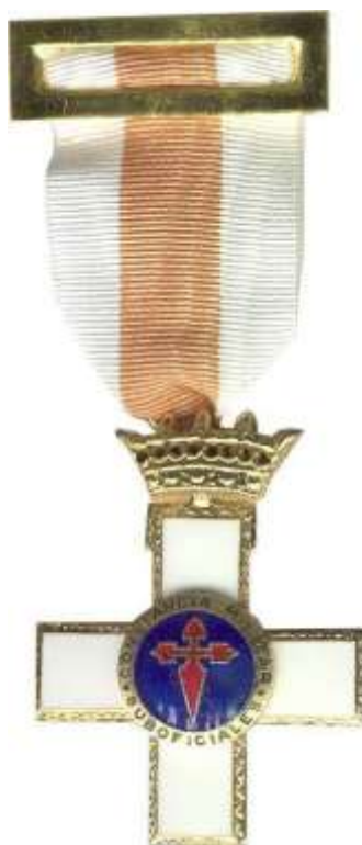
MODELO 1958. CRUZ SIN PENSIÓN