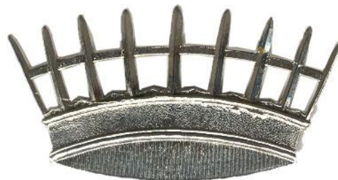
Colectión del autor